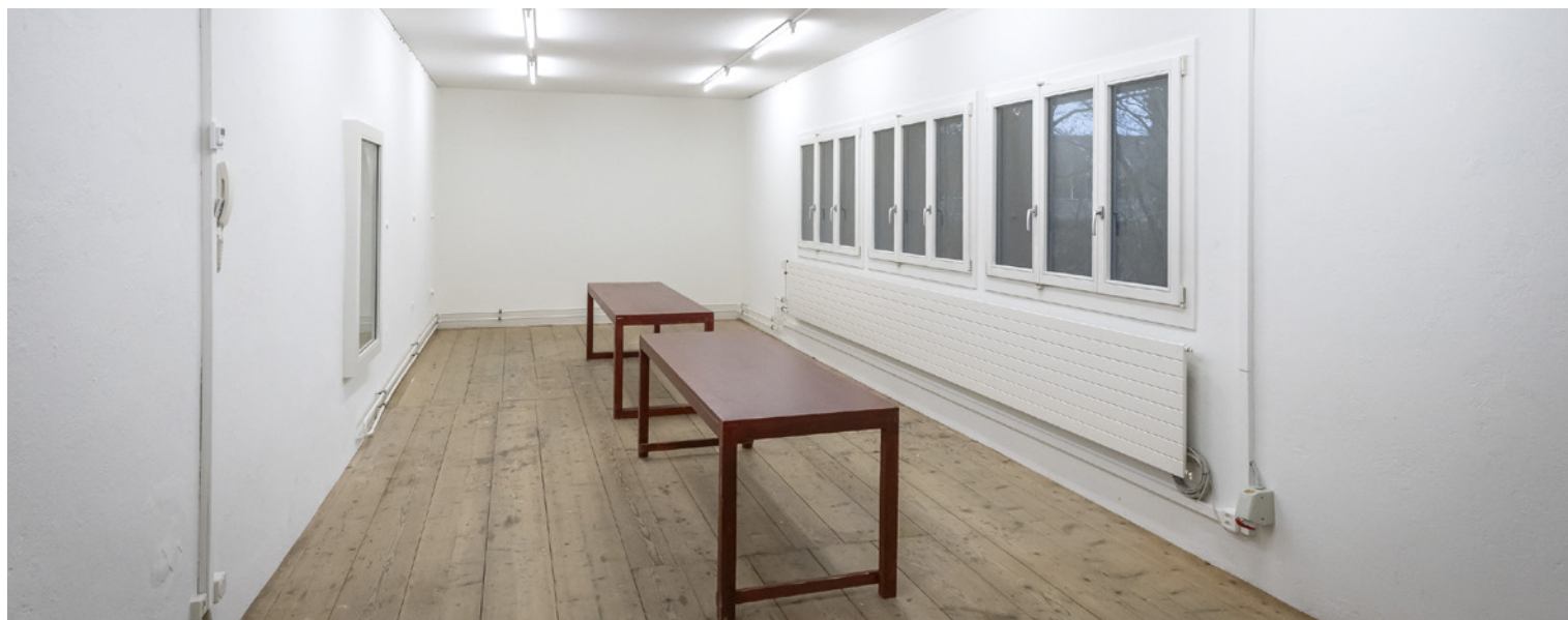
Der Lorzenraum wird ohne Tische vermietet. Mobiliar auf Anfrage.

Es gelten besondere Nutzungsbestimmungen. Die Kenntnisnahme ist beim Checkout zu bestätigen.