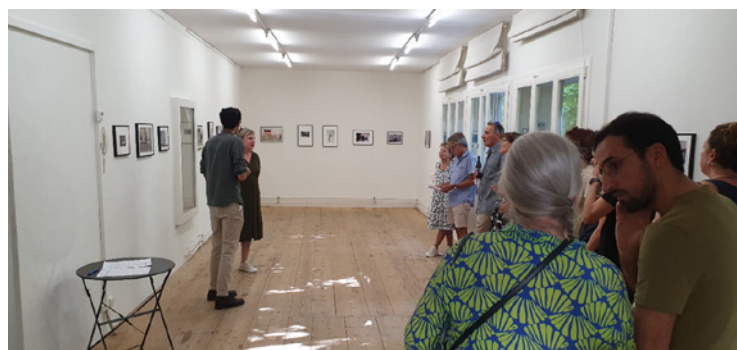
Spotlight Atelier mit Artist Talk