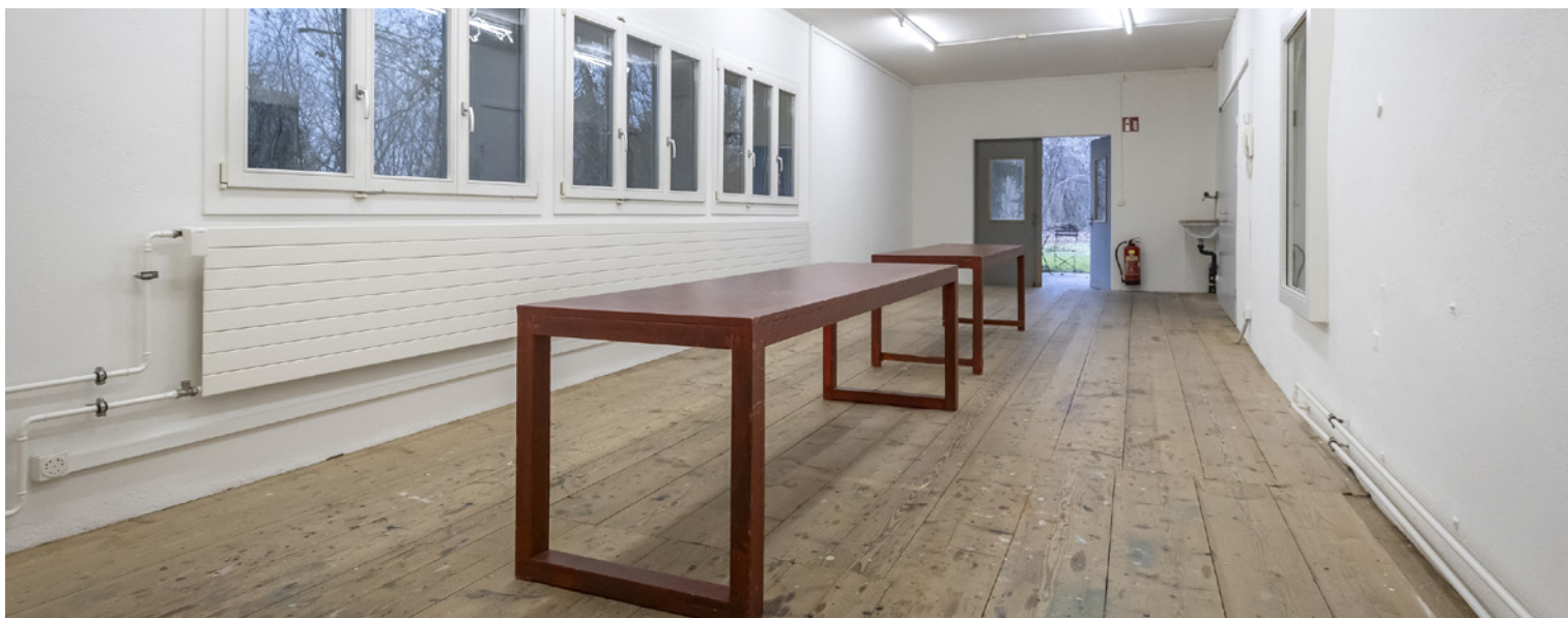
Der Lorzenraum wird ohne Tische vermietet. Mobiliar auf Anfrage.

Bei öffentlichen Veranstaltungen am Wochenende unterstützen wir Sie mit Werbung . Dabei sind wir auf Ihre zeitnah abgelieferten Texte und Bilder angewiesen. Die Details finden Sie in den AGB.