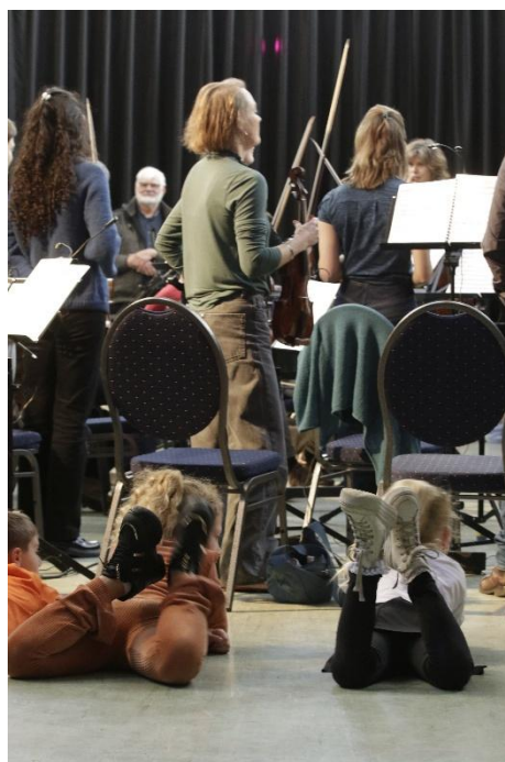
kindervoorstelling tijdens ons Jubileumconcert

We bieden bij de meeste van onze producties een educatieve component aan. Van (publieks-)workshops, inleidingen bij de concerten en de programmering tot openbare repetities en specifieke schoolvoorstellingen of participatie van jeugdkoren. Dit doen we in samenwerking met scholen voor basis- en voortgezet en conservatoria.