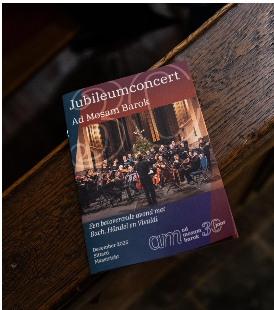
Figuur 1 Programmaboekje van ons Jubileumconcert

Wij constateren dat deze vorm van contextuele verdieping nog altijd zeer wordt gewaardeerd door ons publiek, dat actief vraagt naar de programmaboekjes en met grote interesse luistert naar de toelichtingen tijdens de concerten.