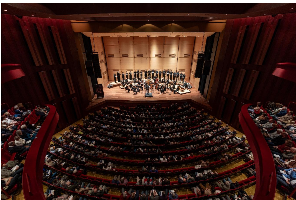
Mozarts Requiem in PLT Heerlen

In België zijn wij regelmatig te gast in Visé, Maasmechelen en Eupen, onder meer in het kader van het Ostbelgien Festival. Deze samenwerkingen onderstrepen en versterken onze positie als Euregionaal ensemble.