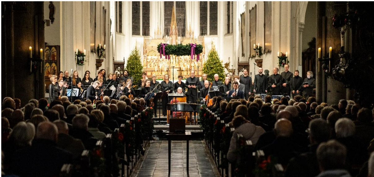
Jubileumconcert: 30 jaar Ad Mosam

Samenvattend kan worden gesteld dat 2025 een jaar van grote veranderingen en interne herstructurering is geweest. Na een onrustige start is in de tweede helft van het jaar gewerkt aan stabilisatie, herstel van vertrouwen en het versterken van de externe positie van de organisatie. Het jaar is afgesloten met twee toonaangevende producties die de artistieke kwaliteit en veerkracht van Ad Mosam onderstrepen. In de volgende hoofdstukken wordt hier nader op ingegaan.