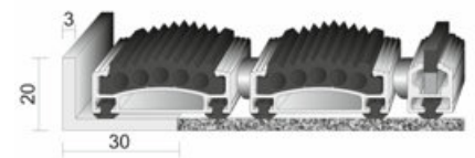
Alumatte Robust - Rips und Bürste Höhe 17 mm

UNSER PROFI-TEAM BERÄT SIE GERNE AUSFÜHRlich!