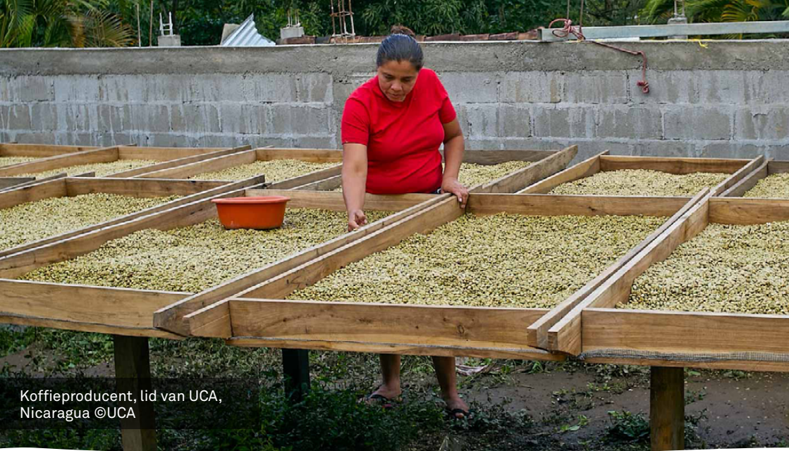
Koffieproducent, lid van UCA, Nicaragua