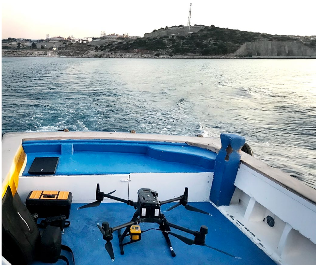
Ileron, Planta de GNL, Detección de Gas Metano con SPH Engineering, UgCS

Para entornos sensibles y extensos como las plantas de GNL, Ileron necesitaba una solución que no solo fuera más rápida y segura, sino que también ofreciera datos más reveladores.