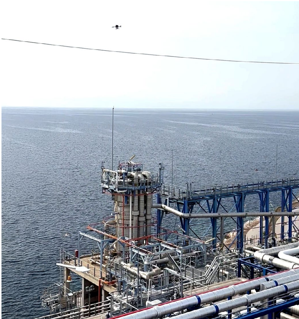
Planta de GNL, Detección de Metano con Drones de Ileron