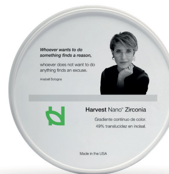
Harvest Nano™ Zirconia

Obtén resultados precisos, consistentes y con un brillo natural en menos tiempo.