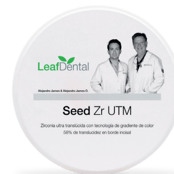
Seed Zr UTM