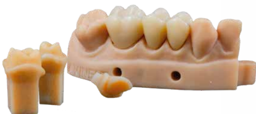
Incluye material para la práctica.*