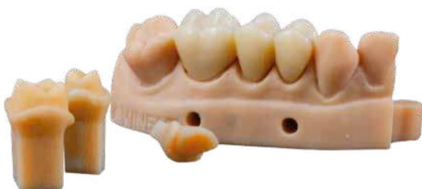
Incluye material para la práctica.*