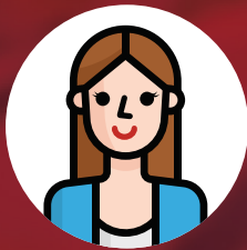
Amy 30 tahun, Sudah berkahwin dengan 2 anak