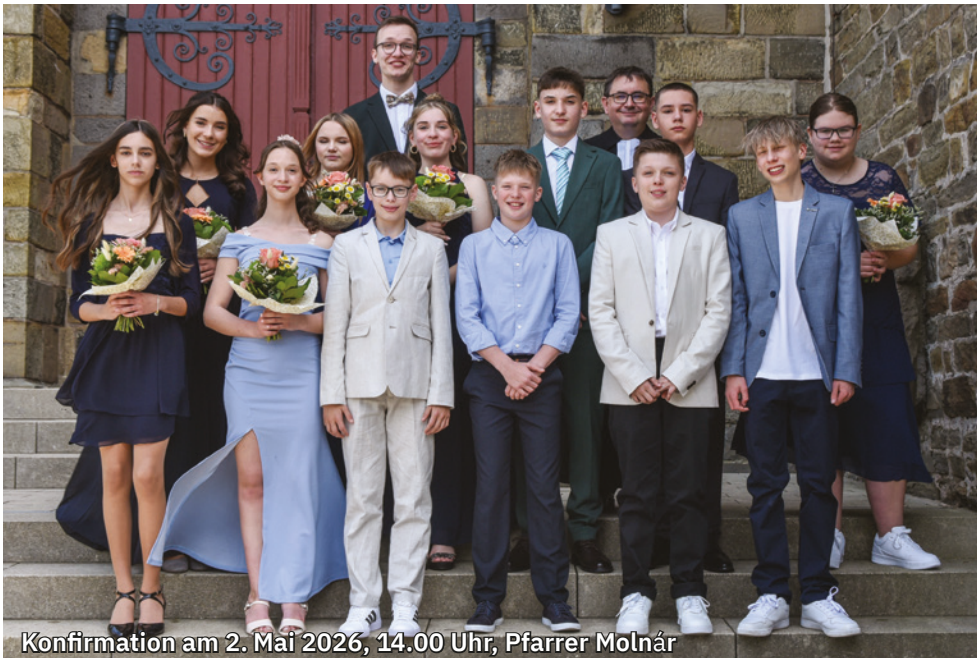
Konfirmation am 2. Mai 2026, 14.00 Uhr, Pfarrer Molnár