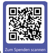
Zum Spenden scannen

Jede digitale Spende an die Diakonie wird verdoppelt! (bis insgesamt max. 100.000 €)