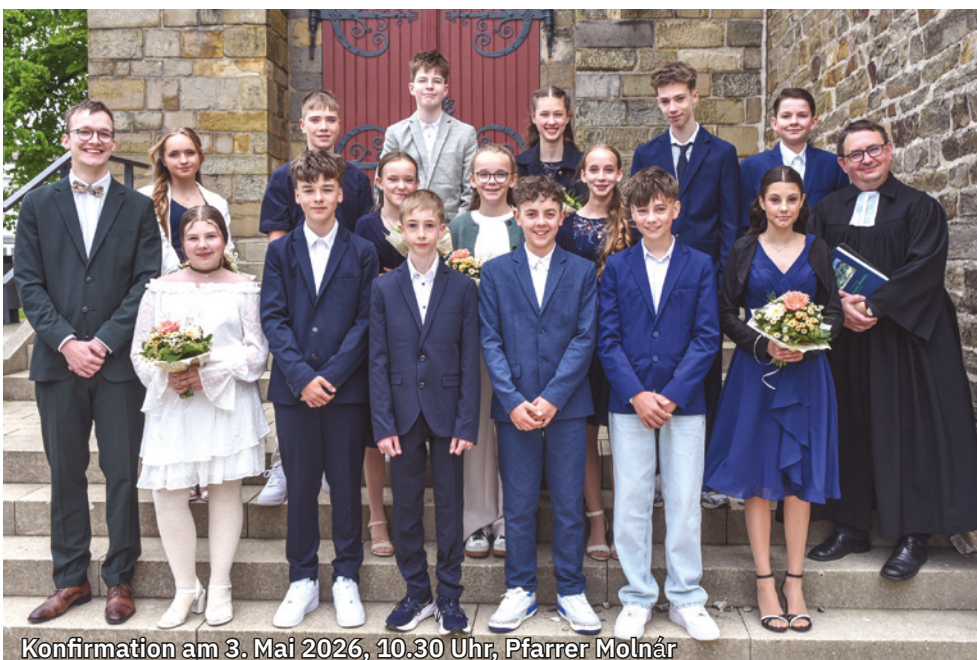
Konfirmation am 3. Mai 2026, 10.30 Uhr, Pfarrer Molnár