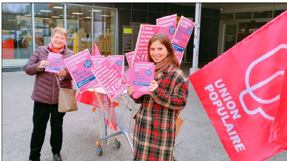
Des militantes de l'UP sur le terrain à Onex-Lancy

Cette désertion facilite par-là la pénétration des discours xénophobes et réactionnaires du MCG et de l'UDC qui parviennent dès lors à capter une part de la colère populaire. En l'absence d'une gauche combative suffisamment présente et forte sur le terrain, ces deux tendances politiques creusent le sillon des victoires de la droite.