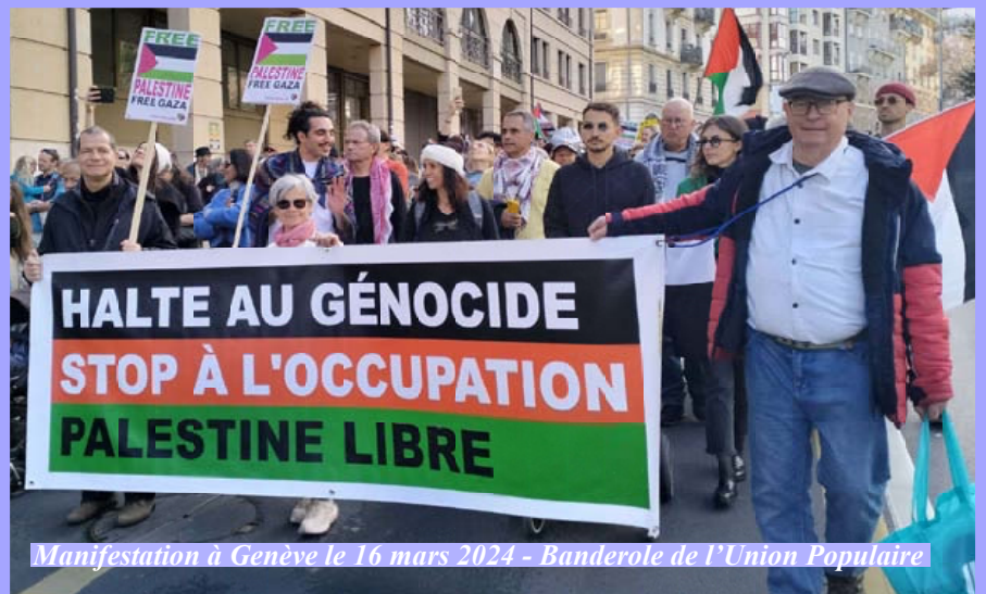
Manifestation à Genève le 16 mars 2024 - Banderole de l'Union Populaire

Le peuple portugais ne doit pas sa révolution aux capitaines, mais aux peuples d'Angola, du Mozambique et de Guinée. En mettant en échec l'armée coloniale, ils l'ont fracturée et poussée à la révolte. Tout paraît dès lors très facile et bien des victoires obtenues pendant un an et demi sont dues au fait que l'appareil répressif s'est évanoui. Mais, dans l'ombre, avec le soutien des puissances impérialistes et avec la légitimation des élections d'avril 1975, cet appareil se réorganise. Le 25 novembre 1975 il remporte une première victoire. (AL)