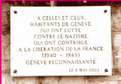
Plaque sur le Consulat de France à Genève