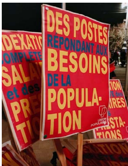
Panneaux UP à l'automne lors des manifs du secteur public...

Le recul des salaires réels contraste avec les profits spectaculaires des entreprises, principalement dans le commerce international (trading), la finance et l'horlogerie de luxe. L'impôt sur les bénéfices a ainsi bondi de presque 600 millions (+32%) par rapport à 2022. Or, les bonnes performances de l'année écoulée dépendent de plus en plus de quelques sociétés.