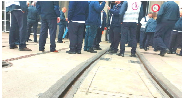
Un dépôt TPG, tous véhicules à l'arrêt lors de la dernière grève