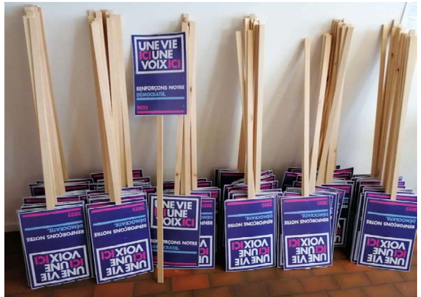
Panneaux du 1 er Mai 2022, à ressortir, à reproduire et à brandir.

Si vous avez un peu de temps pour vous engager dans cette campagne politique importante, prenez contact avec l'Union Populaire pour nous donner un coup de main: signatures à récolter, flyers à distribuer, affiches à coller... il y a du pain sur la planche ! (cf p.12 pour nos informations de contact).