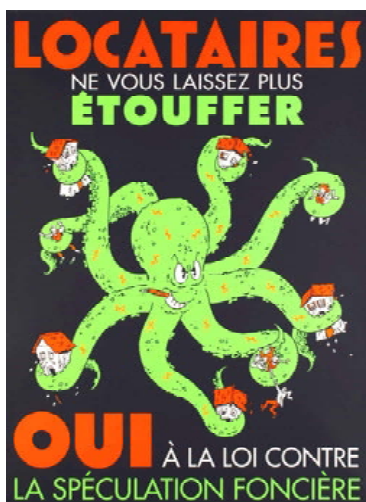
Affiche Exem (an 2000), éd. resp. Christian Grobet, toujours actuelle

11053 C'est le total des signatures (près du double du nombre nécessaire) déposées à l'appui du référendum contre le sabrage de la formation des instituteurs-trices lancé par leur syndicat, la SPG. Bravo ! L'Union Populaire a bien sûr appuyé cette récolte.