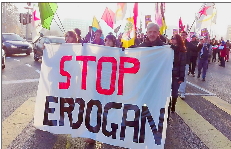
Manifestation à Genève en décembre 2016

Un bon nombre de ces déçus ont reporté leurs suffrages sur le Parti islamiste YRP (Nouveau parti de la prospérité), allié d'Erdogan durant les dernières présidentielles. C'est le successeur du Parti de la Prospérité, dont Erdogan était membre lorsqu'il était devenu maire d'Istanbul, avant