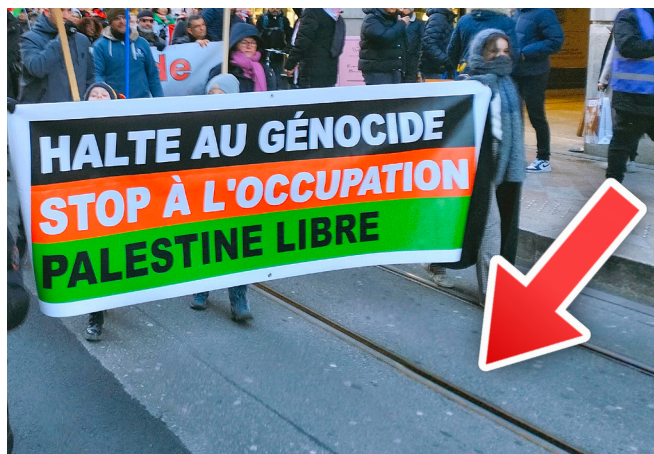
Une manif sur voie de tram proscrite à teneur du projet PLR...

Dans une interview à la Tribune de septembre dernier, la nouvelle conseillère d'État PS en charge de la « sécurité » déclarait « Je revendique un changement de méthode. » En matière de libertés publiques, elle tient parole... en annonçant au nom du Conseil d'État sur Léman Bleu que Genève restreindra massivement le droit de manifester.