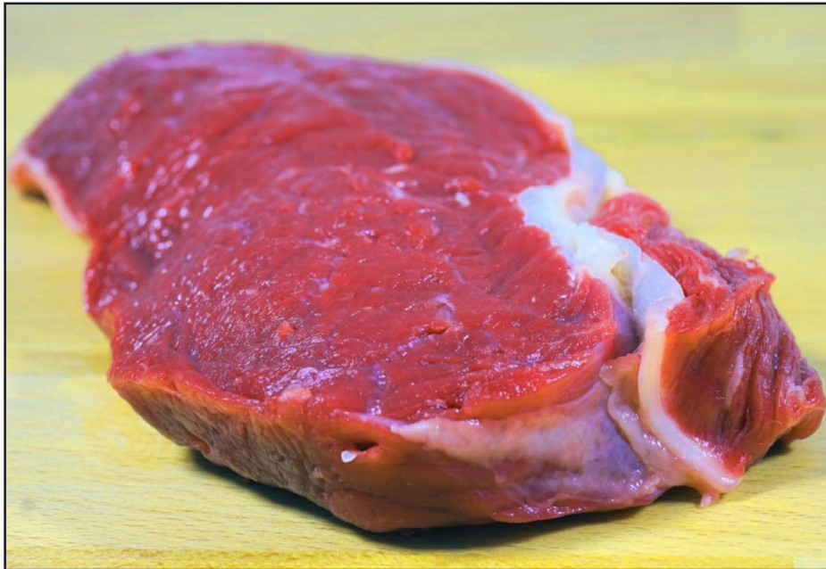
Une consommation de viande qu'il faudrait réduire massivement

Prenons aujourd'hui l'exemple de la viande de synthèse (artificielle). Cultivée à partir de cellules animales. Depuis une dizaine d'années, elle est