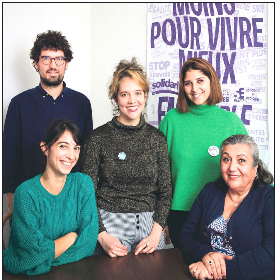
Photo de campagne d'Ensemble à Gauche VD pour l'élection au Conseil d'État en 2021