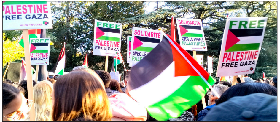
Grande manifestation à Genève le 21 octobre 2023

Pour établir un continuum entre la shoah , l'antisémitisme européen et le