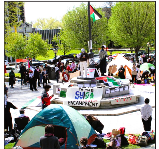
City University of New-York: campement pour Gaza

CH : En Californie, un processus remarquable est en cours. L'UAW 4811, qui représente 48 000 universitaires, mène une grève politique pour la Palestine et la