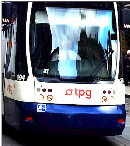
De 25 à 65 ans, restent 40 ans à plein tarif

Mais le parlement a trouvé la ficelle un peu grosse et voté deux lois distinctes. Ainsi, la deuxième loi sur la fixation des tarifs TPG par ukase gouvernemental fera très certainement l'objet d'un référendum. Celui-ci se justifie pleinement, car la fixation des tarifs dans la loi, pour permettre le cas échéant de les contester par voie