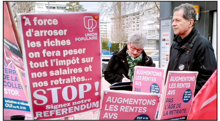
Deux votations fiscales à préparer d'ores et déjà pour la rentrée

Les pertes des communes quant à elles dépasseront 108 millions. Or la loi les oblige à équilibrer leurs comptes, elles seront donc poussées à couper les prestations et les dépenses de personnel! Pierre VANEK