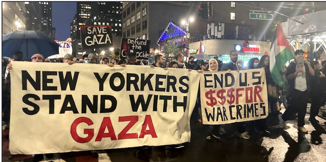
Manif impulsée par les DSA en solidarité avec la Palestine et contre le génocide à Gaza

JB : Comment expliques-tu cette nouvelle radicalisation de la jeunesse ?