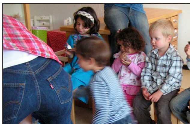
Des jeux cruciaux pour leur avenir se jouent avant l'école...