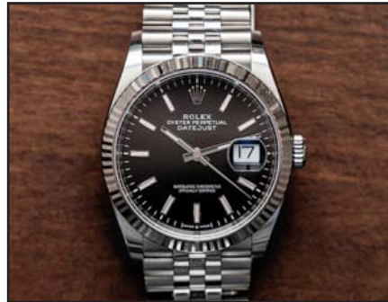
Rolex doit impérativement respecter les droits de ses salarié-e-s

Le directeur a lui-même été congédié en décembre dernier. À coup de plaintes et après l'intervention d'UNIA, des enquêtes ont été lancées