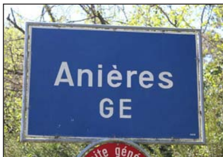
L'une des communes très riches au centime additionnel les plus bas, qui bénéficierait largement de l'initiative ou du contre-projet

Le contre-projet, élaboré en fait par l'Association des communes (ACG) afin de limiter les dégâts de l'initiative de l'UDC, contient certes l'indication que la péréquation fiscale intercommunale, un mécanisme de répartition entre communes riches et pauvres, doit intervenir pour contribuer à rétablir la situation et tenir « notamment compte du rôle des pôles urbains » comme d'autres paramètres (développement des logements, des infrastructures publiques, structure de population et mesures environnementales).