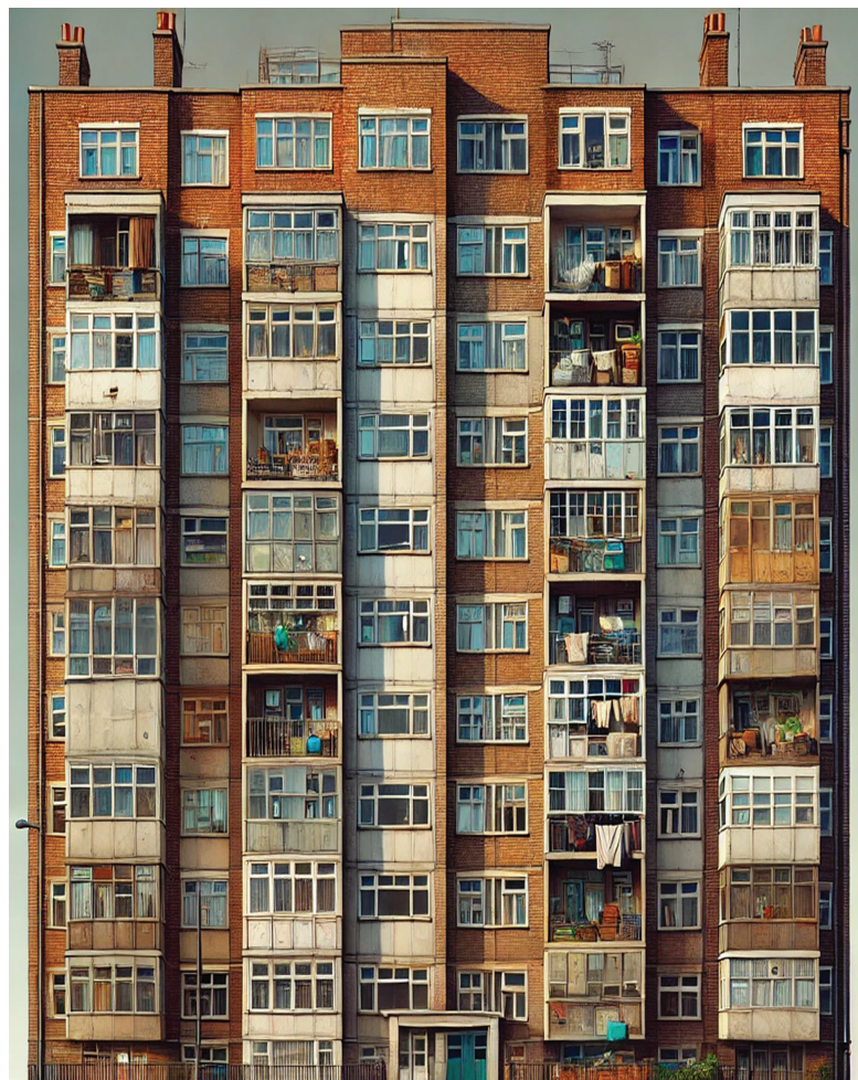
Pour l'Union Populaire un logement abordable est un droit fondamental, pas une marchandise. Les droits des locataires dans ce sens doivent primer sur ceux des propriétaires...

La deuxième loi veut accélérer les procédures pour obtenir un départ plus rapide du locataire, ceci dans le cas où le propriétaire invoque son besoin propre (ou celui de membres de sa famille) d'utiliser les locaux. Aujourd'hui, dans ces cas, si le locataire demande une prolongation de bail (de quatre ans maximum) le juge effectue une « pesée des intérêts » entre locataire et bailleur. L'urgence (ou non) du besoin invoqué par ce dernier sera prise en compte... Avec la nouvelle loi, la notion d'urgence est notoirement affaiblie et remplacée par des critères plus vagues. Le Conseil fédéral avait rejeté le projet affirmant qu'il portait atteinte « à l'équilibre entre les intérêts des deux