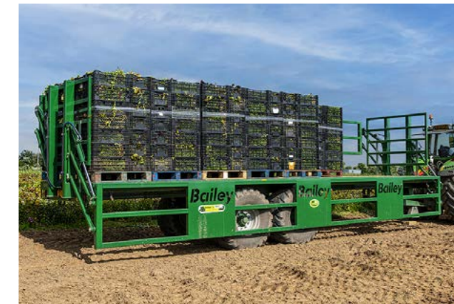
Bailey 16T, 10,2m. 170cm. grinder med 560/60x22,5