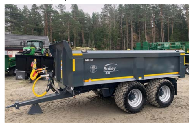
14T dumper med 560/45x22,5.