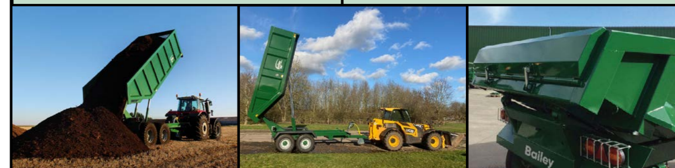
God tipp høyde

Egne priser gjelder ved bestilling til ettermontering.