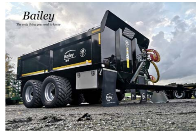
Bailey 14T dumper med 560/45R x 22,5 hjul.