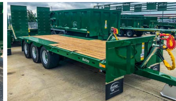
Singeldekk, dørkeplate over hjul og skvettlapper foran.