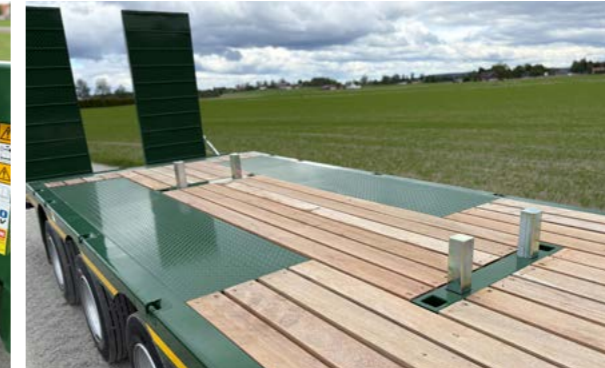
Maskinstopper i plan.