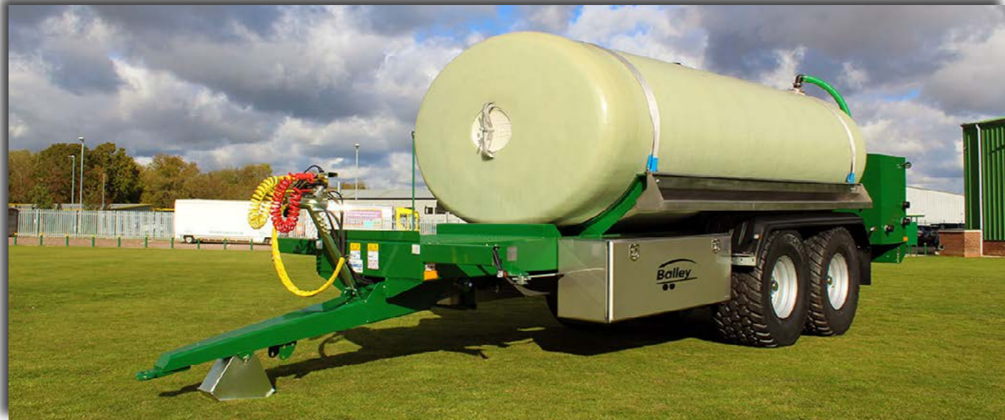
Bailey Vanntank, 4 størrelser. 12,000 til 18,000 liter. Med 1000 L/min pumpe. Pris på forespørsel