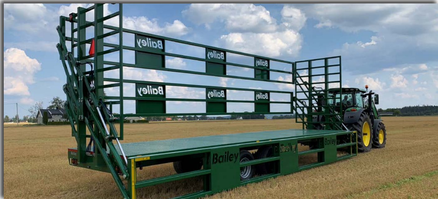
Bailey flat 18. planlengde 1020cm. Høyde på dobbel grind 306cm. Pris fra: 365.000,-

18 Avbildede hengere kan fravike fra standardmodellene. Alle priser er eks.mva. med forbehold om prisendringer og trykkfeil.