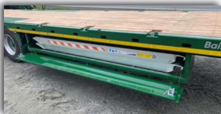
Oppbevaringskasse til ramper. Pris: 7000,-