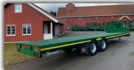
16T. flatdeck med singeldekk 435/50 x 19,5 og skjermsett.

Avbildede hengere kan fravike fra standardmodellene. Alle priser er eks.mva. med forbehold om prisendringer og trykkfeil.