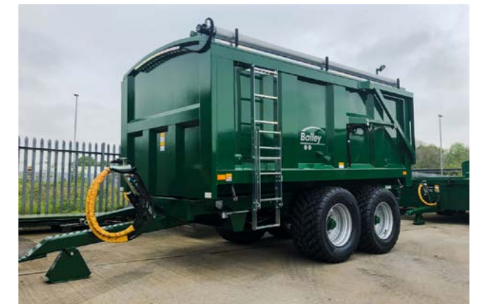
TB10 med hydraulisk presening og 560/45x22,5