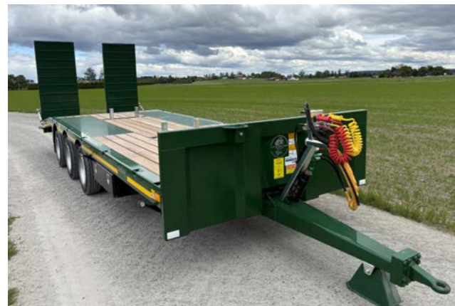
3 akslet low loader.