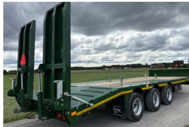
Hydrauliske kjøreramper, 90cm.