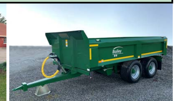
Dumper 12T Lavbygd