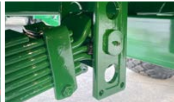
Høydejustering fjærende drag