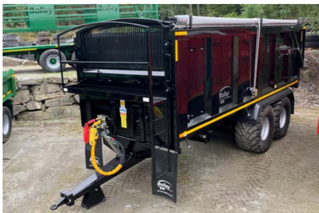
TB18 med hydraulisk baklem og 560x60R 22,5.