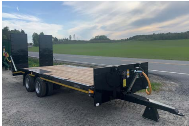
2-akslet low loader med 215/75x17,5