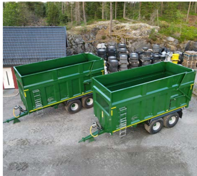
16T med 560/60x22,5 hjul