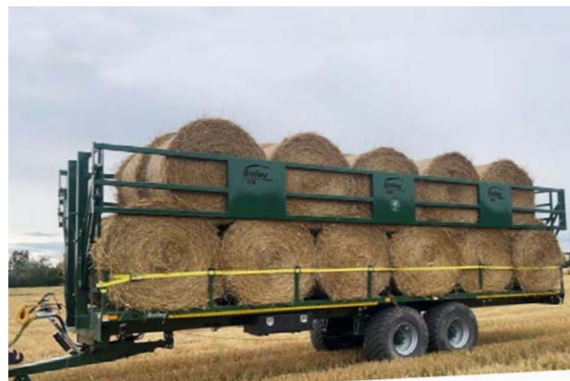
Bailey 18T med 238cm. grinder + 40 cm rekkverk med stropper. med 560/60x22,5. Lastet med 160cm. halmballer