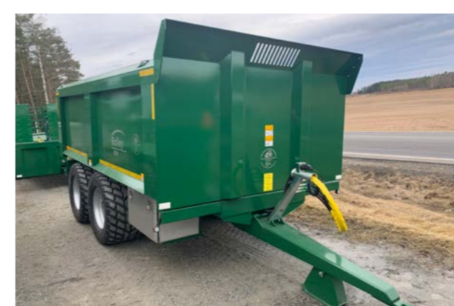
Bailey 14T dumper med 120cm sidekarmer.