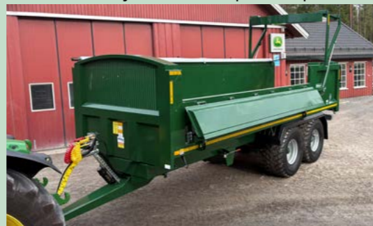
Hydraulisk nedfellbar side. Pris: 29.000,-