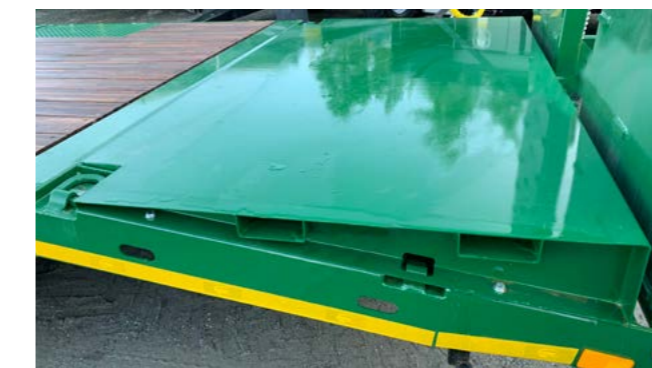
Fill-in til low loader

Egne priser gjelder ved bestilling til ettermontering.