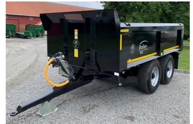
14T dumper med 385/65R x 22,5 hjul.