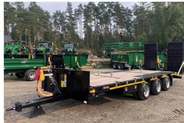
3 akslet low loader med utriggere