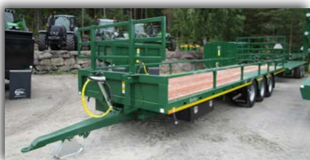
Bailey 24T. 3-akslet med siderekkverk og singeldekk.

Egne priser gjelder ved bestilling til ettermontering.