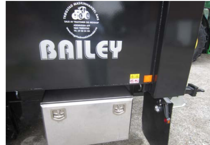
Verktøykasse, rustfri og ryggelys med frontskvettlapper

18 Avbildede hengere kan fravike fra standardmodellene. Alle priser er eks.mva. med forbehold om prisendringer og trykkfeil.