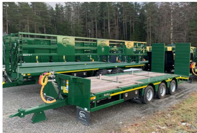
3 akslet low loader med skjermsett og underkjøringsvern.