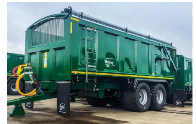
TB18 med hydraulisk presening og 560x60R 22,5