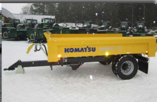
Fargetilpasset etter ønske.