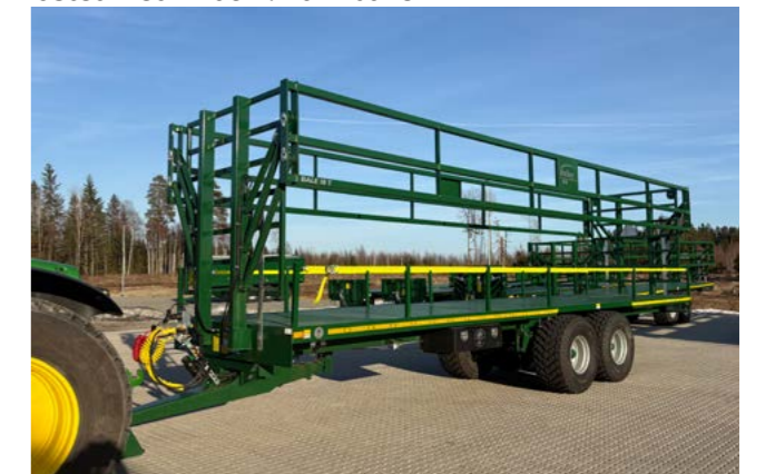
Bailey 18T med hydraulisk sidegrinder 238 cm høyde og 40 cm rekkverk med stropper. 560/60x22,5