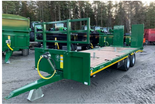
2 akslet low loader med 435/50 x 19,5