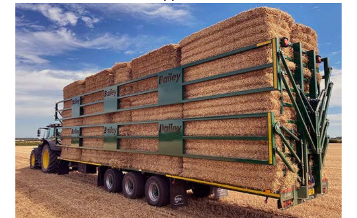
3 akslet 18T Bale 10,2m. 306 cm. grinder med 435/50x19,5. Lastet med firkantballe