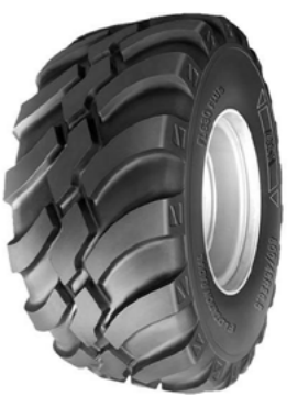
BKT FL-630 560/45R x 22,5

Avbildede hengere kan fravike fra standardmodellene. Alle priser er eks.mva. med forbehold om prisendringer og trykkfeil.