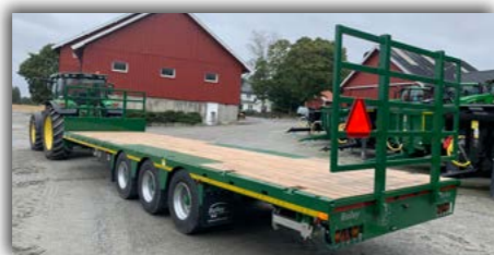
24T flatdeck med singeldekk 435/50 x 19,5 og skjermsett. Hardtre i bunn.