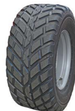
Nokian Country King 560/60R x 22,5