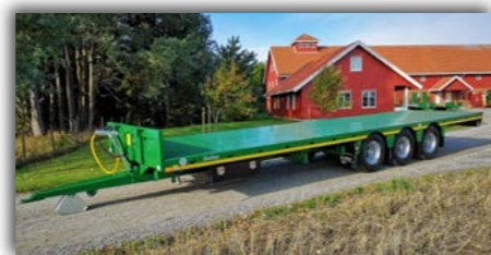
24T. flatdeck med singeldekk 435/50 x 19,5 og skjermsett.