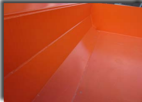
Avrundet fremvegg i 8mm. Hardox.