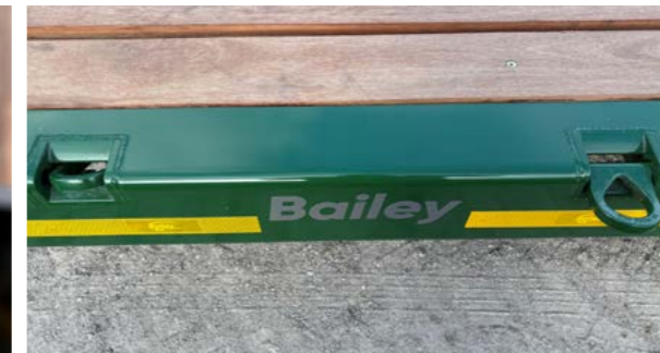
Nedfellbare surrefester på maskinhenger