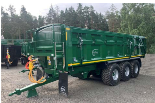
TB 24 3-akslet med hydraulisk side og følgeaksel.