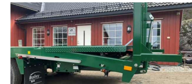
Hydraulisk skråplan fill-in