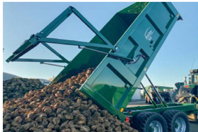
TB12 med hydraulisk baklem.