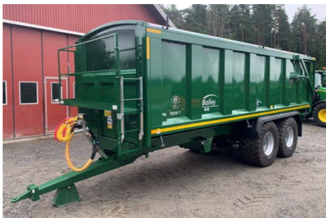
TB20 med hydraulisk baklem og 560x60R 22,5.