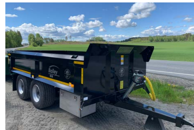
Bailey 12T lavbygd dumper med 435/50R x 19,5 hjul.