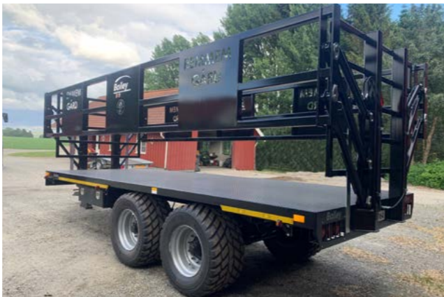
Bailey 14T. 6,6m. 170cm. grinder med 560/45x22,5