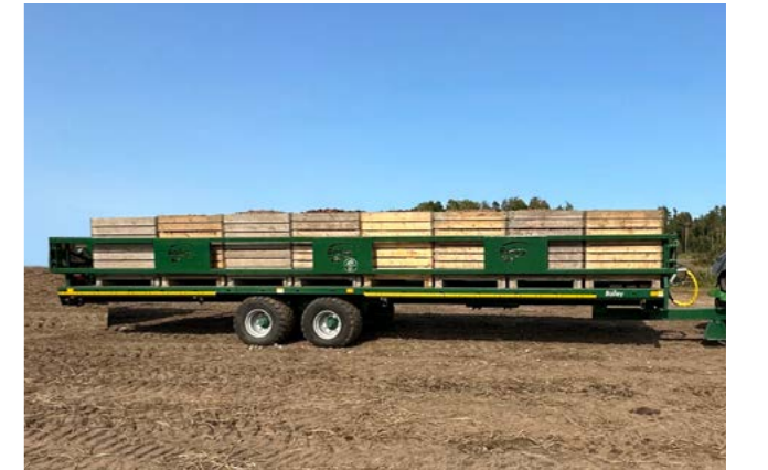
12T 10,2m. 85cm. grinder med 500/50x17 Lastet med 800kg. potetkasser