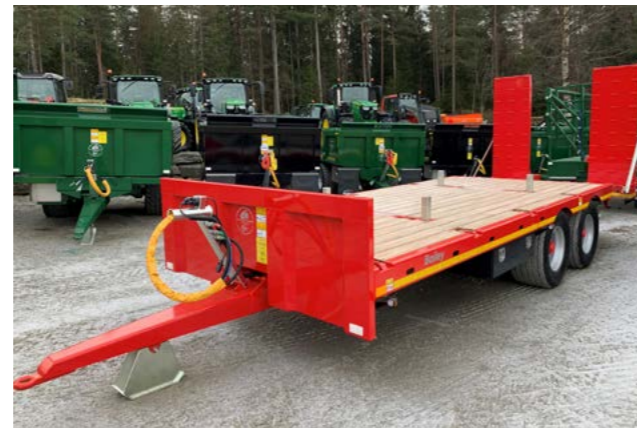
2 akslet low loader med 435/50 x 19,5