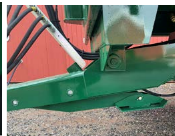
Integrert hydraulisk støttefot Pris på forespørsel