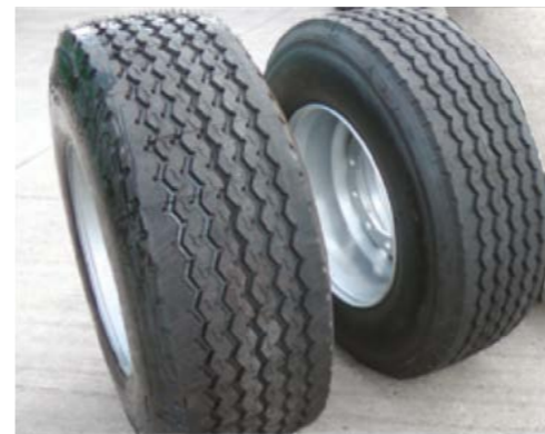
Fra venstre: 445/65R22,5, 385/65R22,5