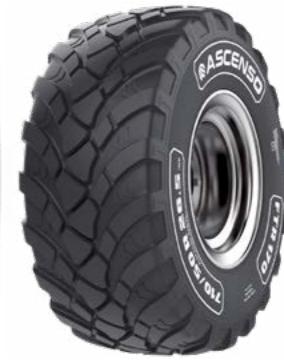
Ascenso FTR 170 560/60R x 22,5