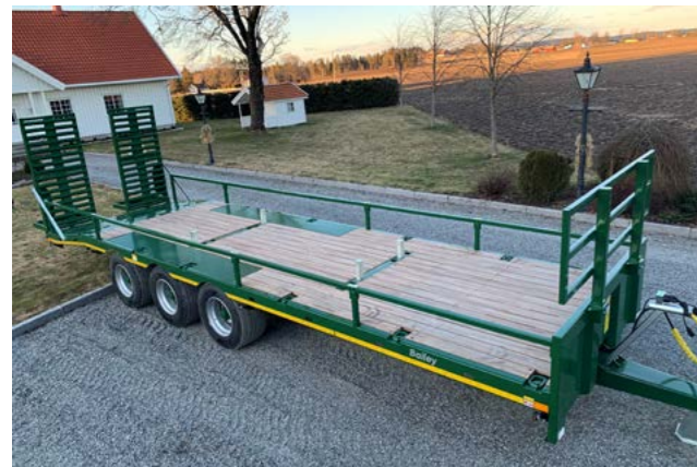
3 akslet low loader med åpne ramper og 40 cm rekkverk.