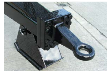
Schermüller boltet trekkøye, skrufeste 160x160 M20. 12 bolt