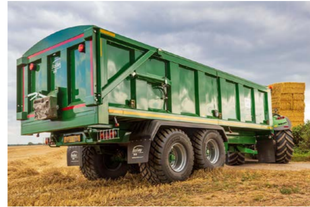
TB20 med hydraulisk baklem.