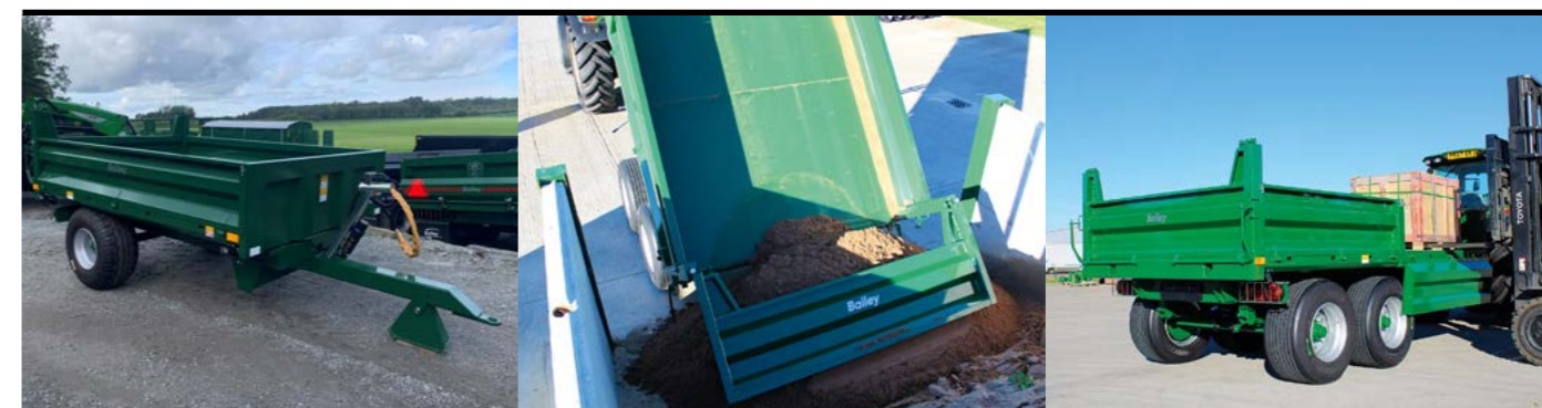
Dropside 4T. Pris fra 84.000,-