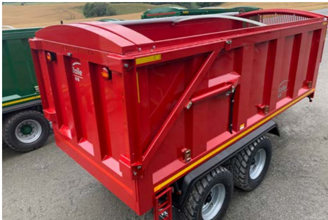
TB14 med hydraulisk baklem og 560/45x22,5.