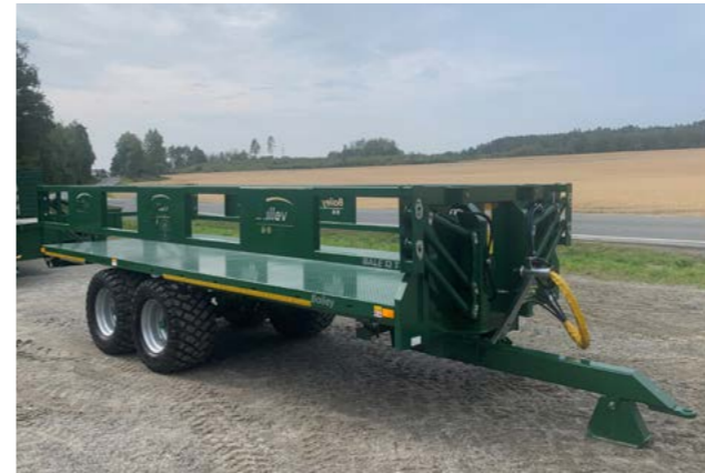
Bailey 12T 6,6m. 85 cm. grinder med 560/45x22,5