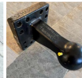
Schermüller skrufeste med kule, 80mm.