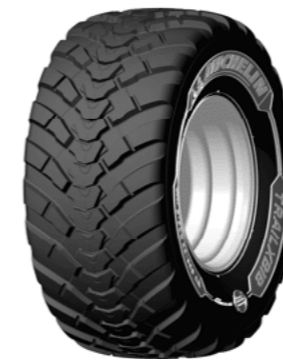
Michelin TrailXbib VF 560/60R x 22,5