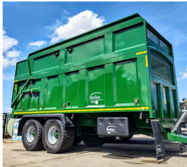
16T med 30cm blowboard på siden.