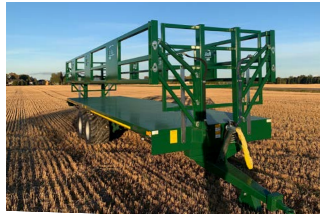
Bailey 18T. med 600/50 x 22,5