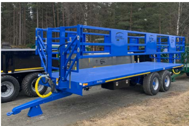
Bailey 18T. 9,3m. 170cm. grinder. 445/65 x 22,5