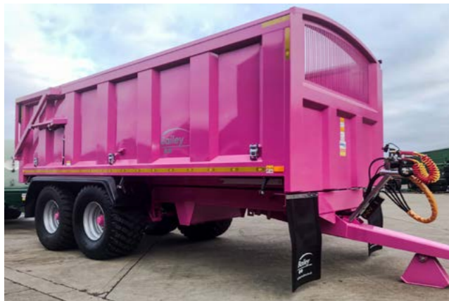
TB 16 Lakkert i egendefinert farge og 560/60x22,5.