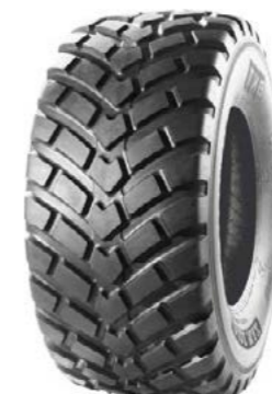
BKT Ride Max FL693 560/60R x 22,5