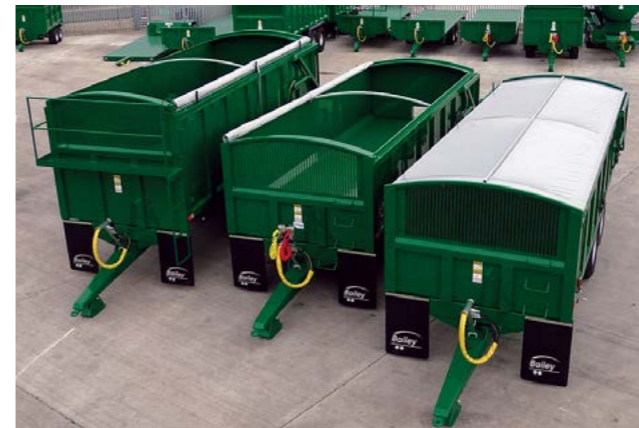
Rullepresening, valgfri til høyre eller venstre side.