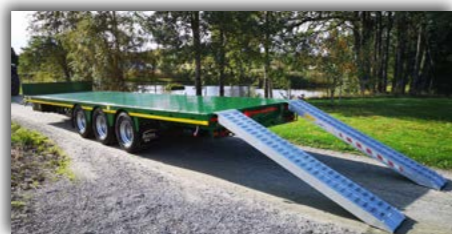
Aluminiumsramper maks belastning pr. par 9.000kg. Pris: 8000,-