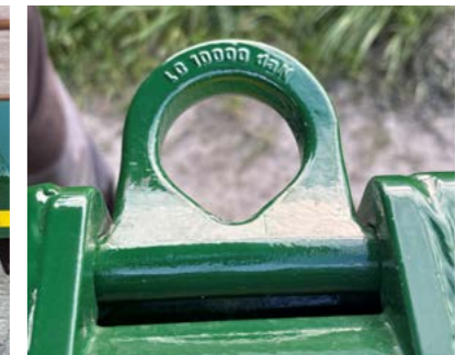
Surrefeste LC 10000 daN