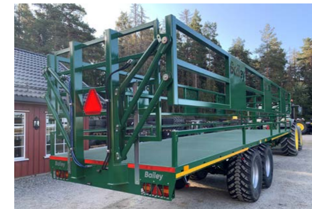
Bailey 18T med hydraulisk sidegrinder og 40 cm. rekkverk. 560/60x22,5