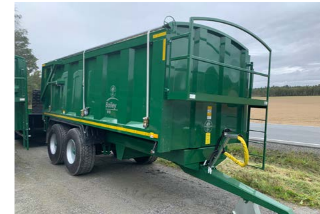
TB16 med hydraulisk baklem og 445x65R 22,5