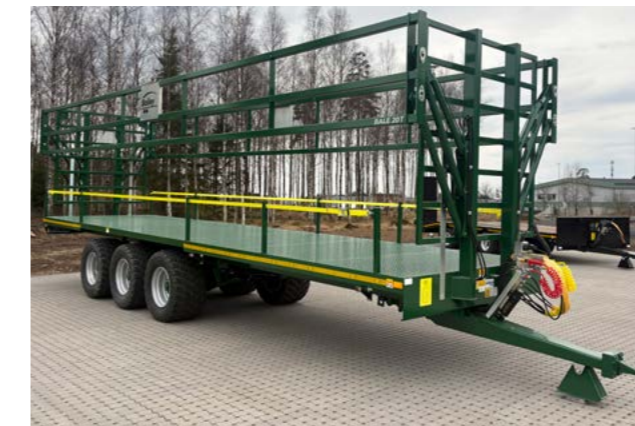
Bailey 20T. med hydrauliske sidegrinder. 560/45x22,5