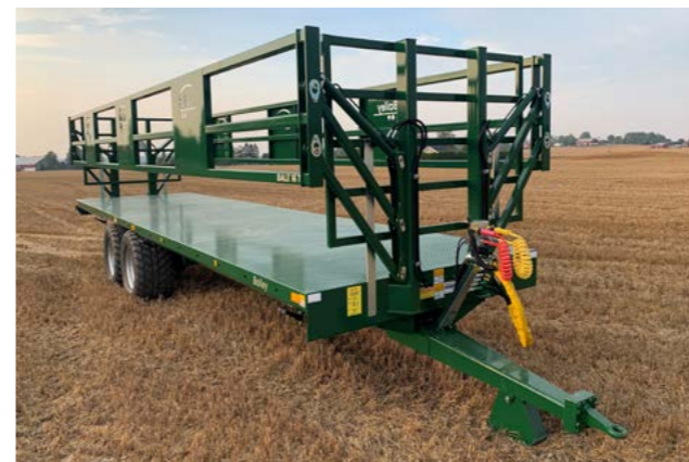
Bailey 16T 10,2m. 170cm. grinder med 560/45x22,5