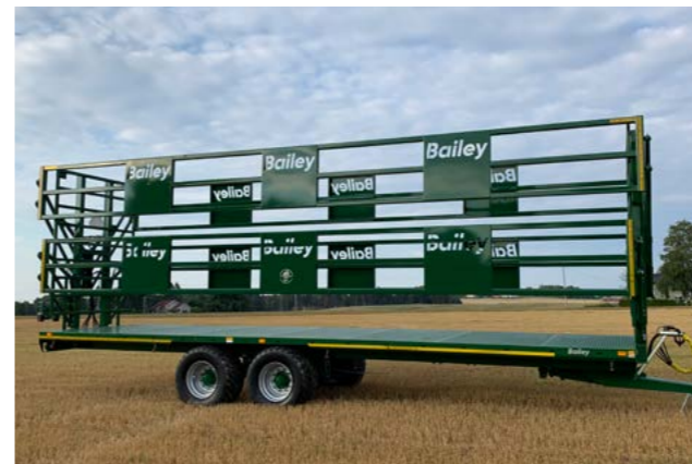
Bailey 18T. med hydrauliske sidegrinder i to høyder. 560/45x22,5.