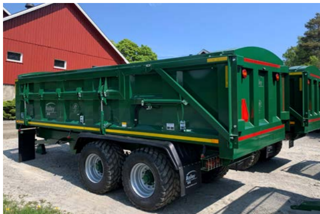
Root 14 med hydraulisk side og 560/45 22,5.