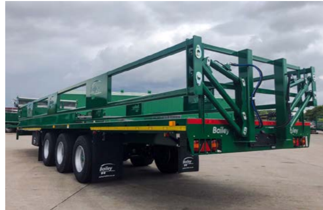
Bailey 18T 3aks, 10,2m. 85cm. grinder med 435/50x19,5