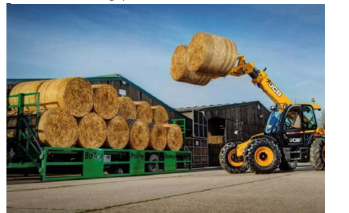
Bailey 12T. 7,5m. med 170cm. grinder med 500/50x17 Lastet med 120cm. halmballer