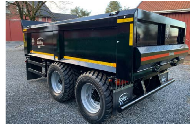
14T dumper med underkjøringsvern og Nokian CK 560/45R x 22,5 hjul.