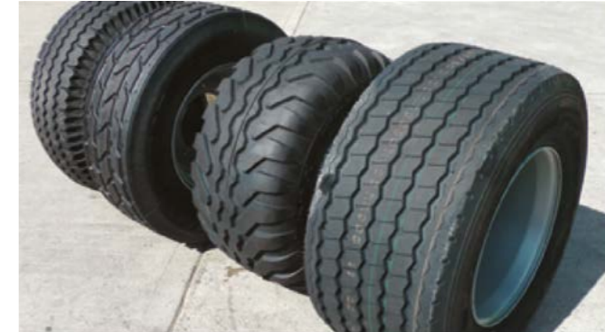
Fra venstre: Vredestein 12.5x80x15,3, Michelin 340/65R18, Vredestein 400/60x15,5, Double Coin 435/50R19,5