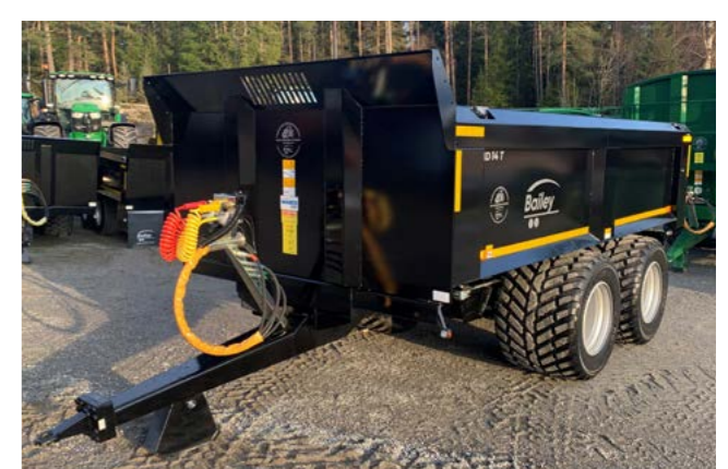
Bailey 14T dumper med Nokian CK 710/35R x 22,5 hjul.