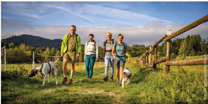
Hotel »Der Wolfshof«/Stefan Schatz