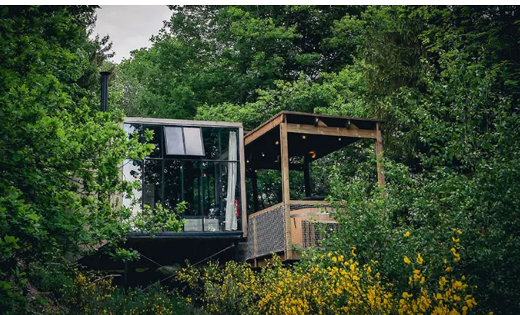
Urlaub mitten im Grünen: In den Baumhäusern von Nutchel seid ihr der Natur ganz nah

Für die einen ist es ein richtiges Familienabenteuer, für die anderen ein gemütlicher Rückzugsort für intensive Familienmomente und für einige von euch sicherlich eine kleine Challenge, eine Art Urlaubsexperiment à la „Back to the Roots“. Klar ist: Ein Familienurlaub in den Nutchel Cosy Cabins im Elsass (Frankreich) ist alles andere als eine 08/15-Auszeit.