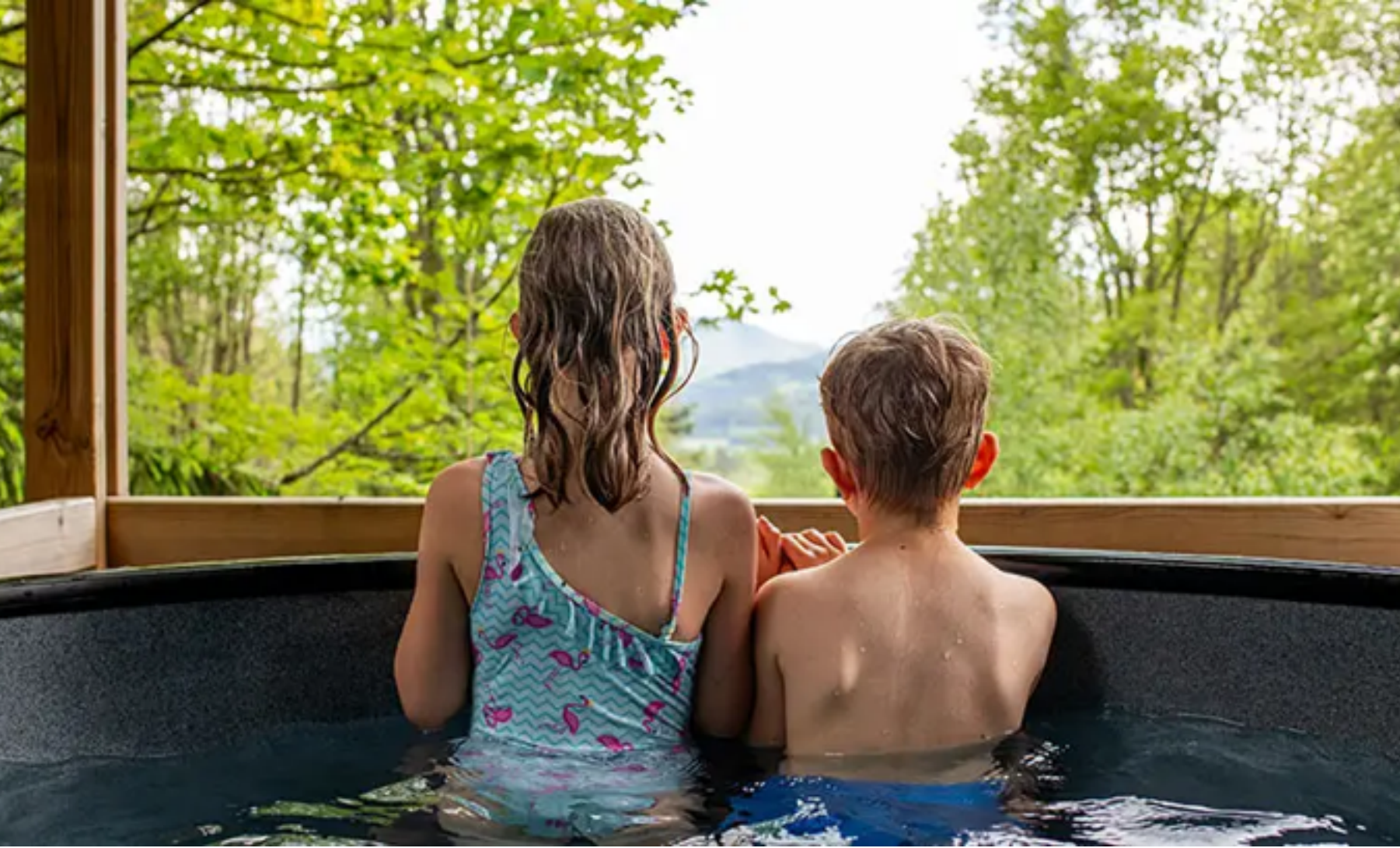
Baden mit Ausblick: Einige der Nutchels verfügen über einen Hot Tub auf der überdachten Terrasse

Das fängt schon mit den außergewöhnlichen Urlaubsdomizilen an: Bei den Cabins handelt es sich um schnuckelige kleine Baumhäuser aus Holz mit großem Panoramafenster, sodass ihr das Gefühl habt, ihr wärt mitten in der Natur. Ausgestattet sind sie mit allem, was ihr für einen Urlaub mit Kindern braucht: Schlafzimmer mit kuschelweichen Betten, eine Küche, ein kleines Bad mit fließendem (warmem!) Wasser, ein Wohnzimmer mit einem gemütlichen Ofen und eine überdachte Terrasse, auf der bei einigen Cabins sogar ein Hot Tub steht.