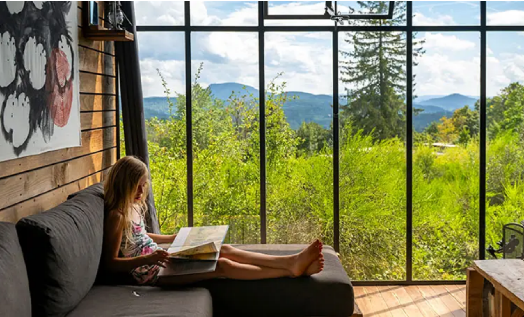
Besser als Kino: der Ausblick aus den bodentiefen Stahlfenstern

Wir nehmen es lieber vorweg: Wer Luxus und dauerhaftes Entertainment erwartet, ist hier fehl am Platz – es sei denn, ihr versteht unter Luxus etwas anderes: Urlaub mitten im Grünen zum Beispiel. Familienzeit genießen ohne Ablenkung durch Smartphone, TV und Co. abends auf der Terrasse gemeinsam in der Hängematte liegen und dabei den Geräuschen der Natur lauschen und in den funkelnden Sternenhimmel blicken. Himmlisch!