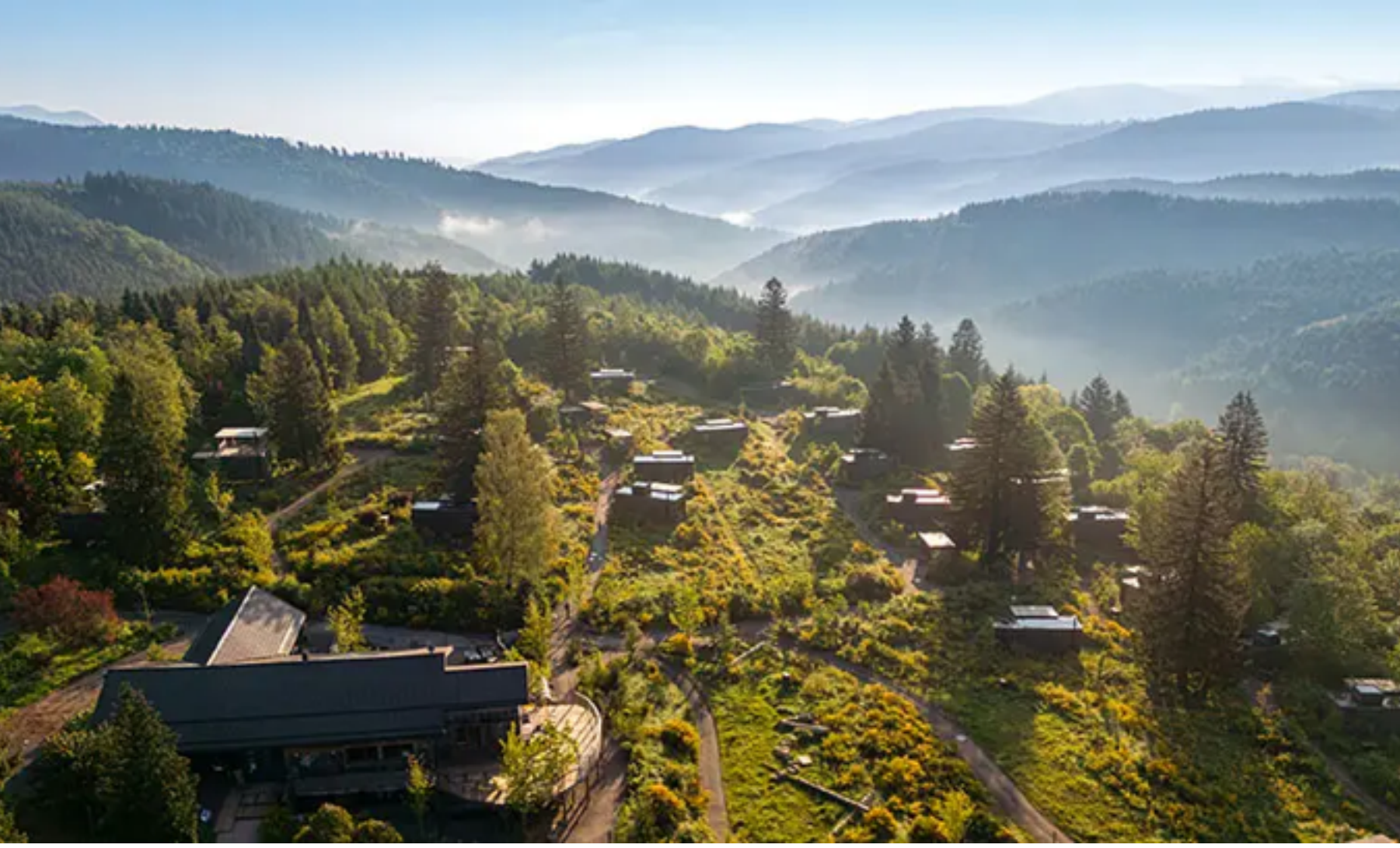
37 Baumhäuser in verschiedenen Kategorien tummeln sich auf dem weitläufigen Gelände

Disconnect to reconnect – so lautet das Motto der bei aller Schlichtheit doch stylischen Cosy Cabins von Nutchel. Und tatsächlich fällt es hier leicht, den Alltag loszulassen, sich an den kleinen Dingen zu erfreuen. Das liegt natürlich auch daran, dass sich dieses Forest Village aus 37 Baumhäusern in eine malerische Landschaft duckt, umgeben von jahrhundertalten Bäumen und den Hügeln der Vogesen.