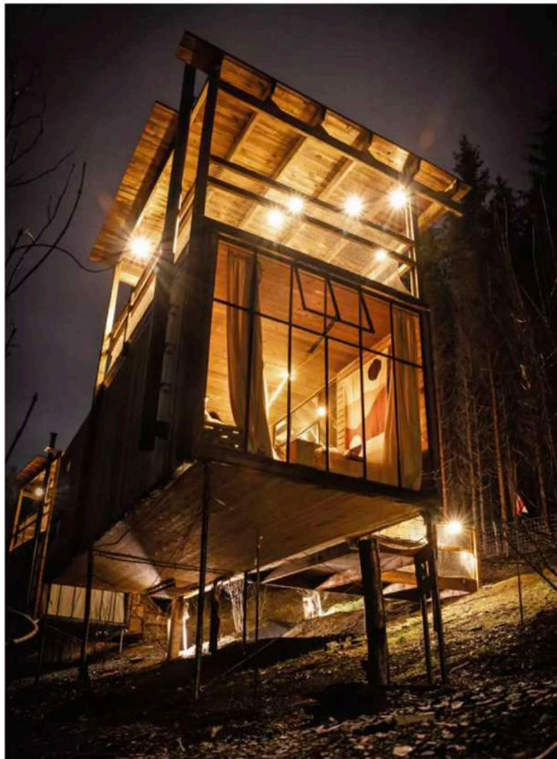
In jeder Cabin sorgt ein Panoramafenster für den Weitblick

W ie jede vernünftige Hundebesitzerin beschäftigt mich hin und wieder die Frage, wann, wie und wo mein Hund wohl am glücklichsten ist. Auf der Seite der Harvard Medical School habe ich von einer Studie gelesen, die sich mit der emotionalen Beziehung zwischen Mensch und Hund beschäftigt. Vereinfacht gesprochen ist das Ergebnis dieser Untersuchung: Ist der Mensch fröhlich, ist auch der Hund besser drauf. Es hängt also von mir ab, wann, wie und wo mein Hund am glücklichsten ist. Und das führt mich direkt zur Sache mit dem Glamping.