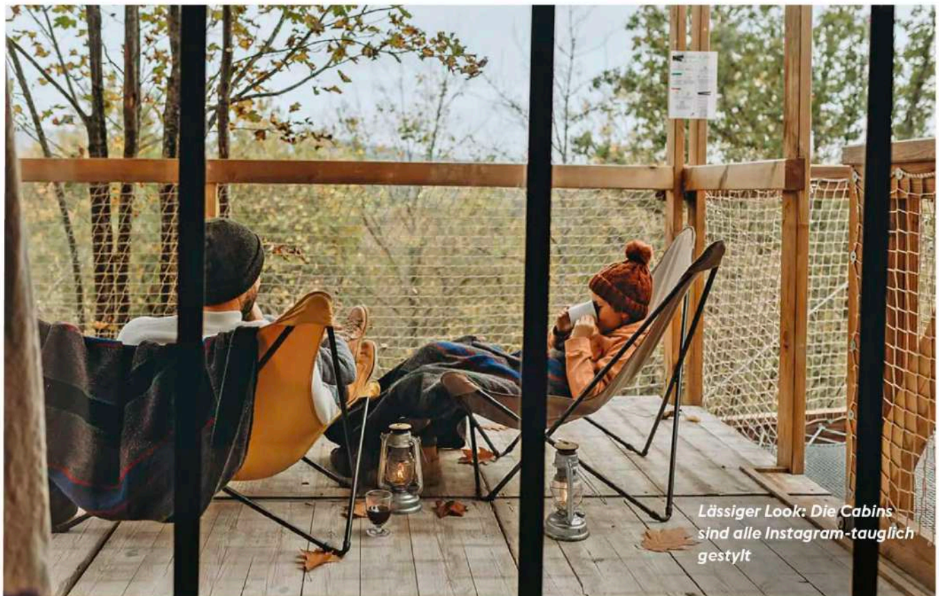
Lässiger Look: Die Cabins sind alle Instagram-tauglich gestylt