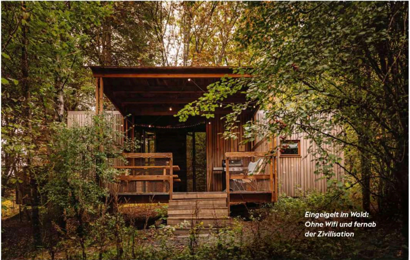
Eingeigt im Wald: Ohne Wifi und fernab der Zivilisation