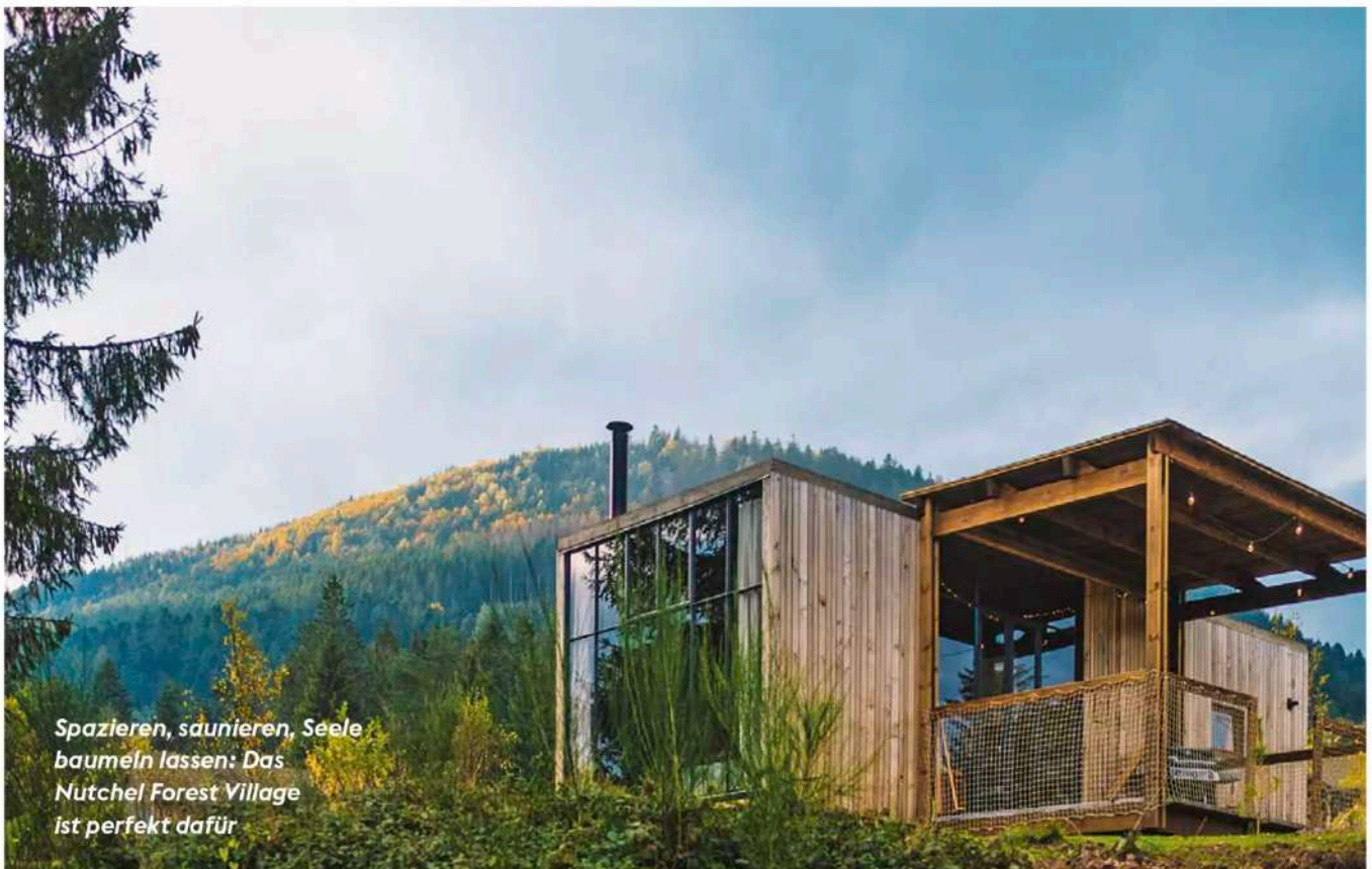
Spazieren, saunieren, Seele baumeln lassen: Das Nutchel Forest Village ist perfekt dafür

mallow verkaufen, sondern auch selbst gemachte Marmelade, frische Croissants, Zutaten fürs Raclette und alles, was Nutchel-Gäste zum Leben brauchen. Mittlerweile kennt jeder meiner Hund, und keiner merkt über seine Eigenwilligkeiten. Stattdessen bekommt er von den Mitarbeiterinnen Leckerlis zugesteckt. Und ich zwei Eier, als Geschenk, weil sie beim Einchecken vergessen haben, dem Tier ein Hundebett mitzugeben. Das Leben fühlt sich ziemlich leicht an im Nutchel-Village. Keine Ahnung, ob Glamping immer so ist, doch falls ja: Das mache ich wieder. ■