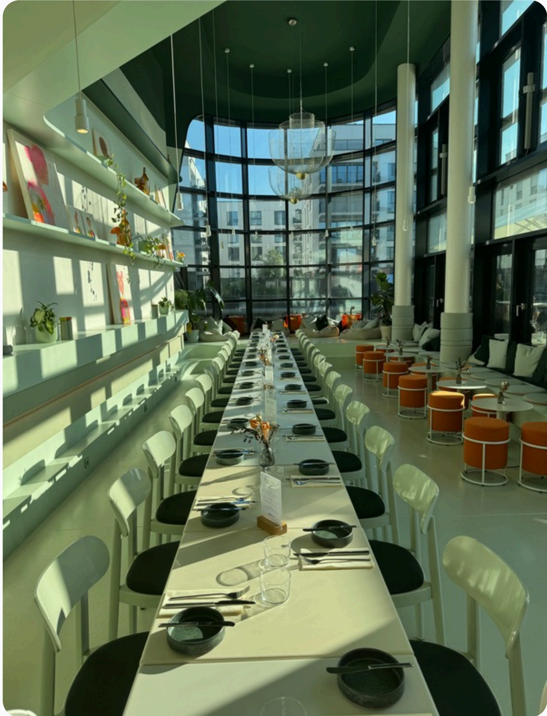
beispiel tafel bis zu 30 (+) personen am tisch gesetzt