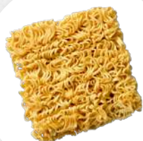
MACARRÃO INSTANTÂNEO 1 EMBALAGEM