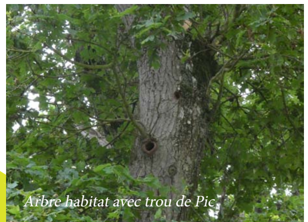
Arbre habitat avec trou de Pic