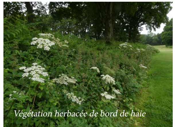
Végétation herbacée de bord de haie

•Des espèces menacées recensées. « Les chardonnerets ont tendance à régresser en France. Je les ai débusqués nombreux dans les haies du golf. Ce n'était pas le cas en 2019. Preuve de l'importance de préserver et de développer le bocage. » La présence de fauvelles des jardins, une espèce menacée, a également été relevée. « Quand un mâle chante dans une haie, c'est un indice de nidification possible. »