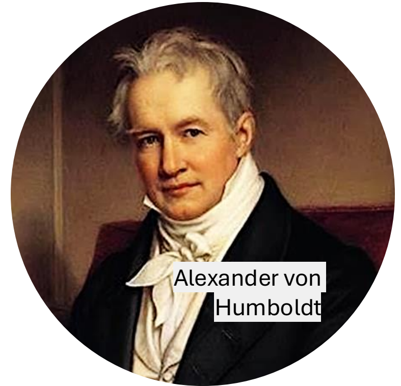
Alexander von Humboldt