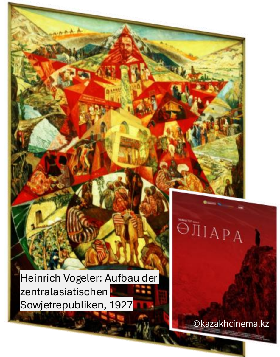
Heinrich Vogeler: Aufbau der zentralasiatischen Sowjetrepubliken, 1927