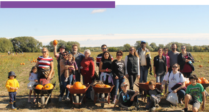
Centre d'Interprétation de la Courge, Saint-Joseph-du-lac, Activité ABL