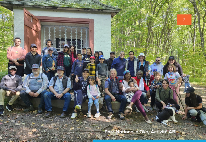
Parc National d'Oka, Activité ABL