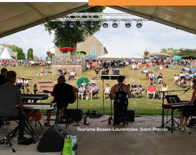
Tourisme Basses-Laurentides- Saint-Placide