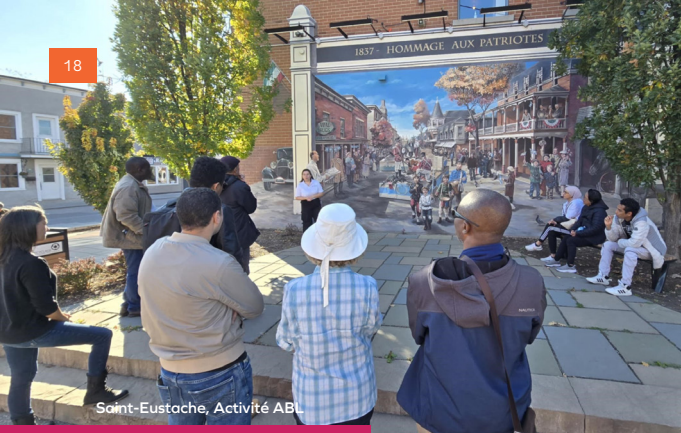
Saint-Eustache, Activité ABL