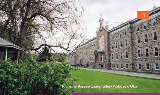
Tourisme Basses-Laurentides- Abbaye d'Oka