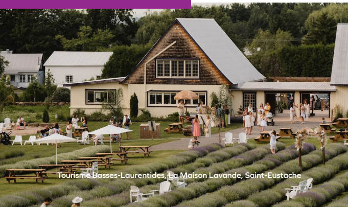
Tourisme Basses-Laurentides, La Maison Lavande, Saint-Eustache