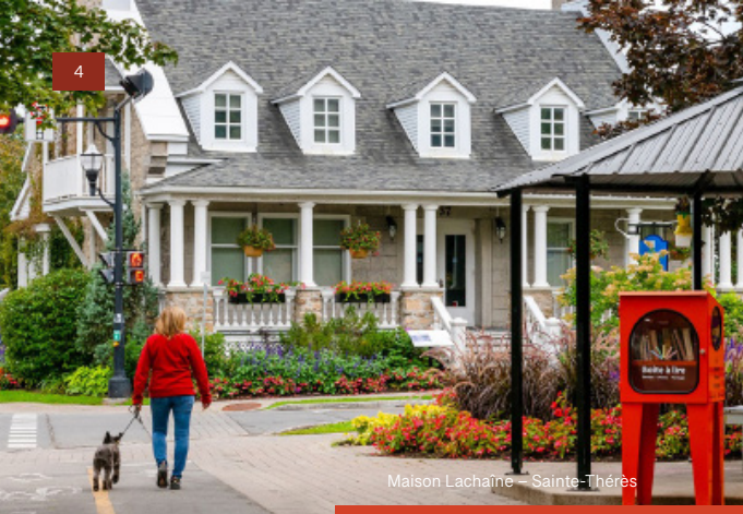
Maison Lachaine – Sainte-Thérèse