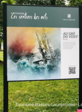
Tourisme Basses-Laurentides- Lorraine.