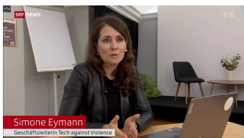
Les cyberviolences au sein du couple à la une de SRF en octobre et novembre 2025.