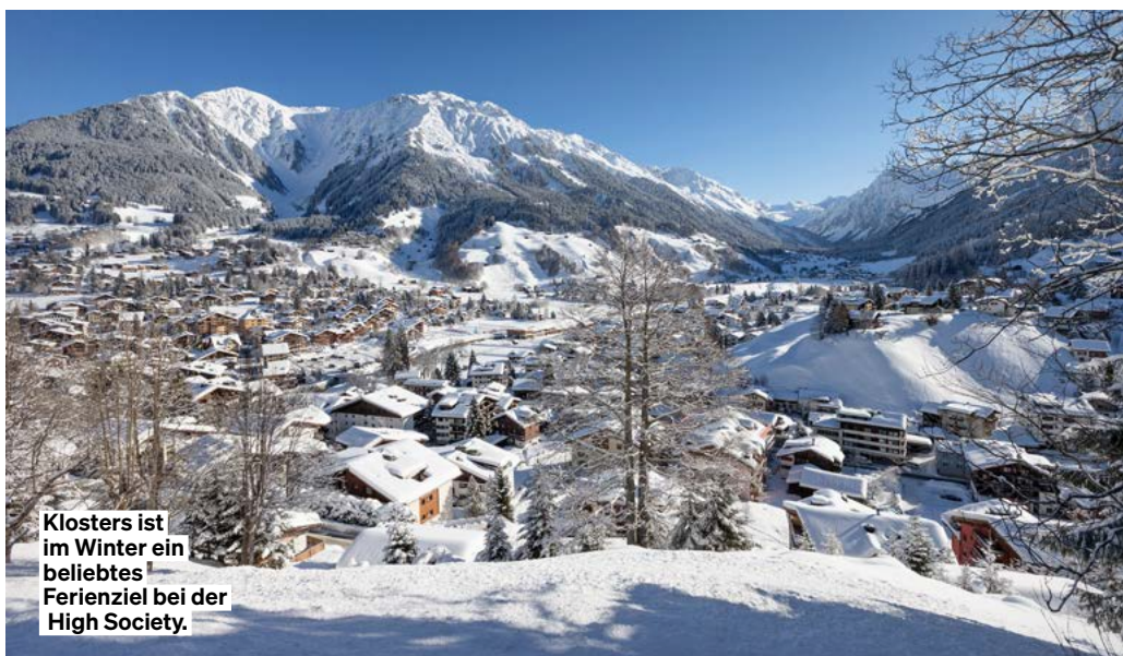
Klosters ist im Winter ein beliebtes Ferienziel bei der High Society.