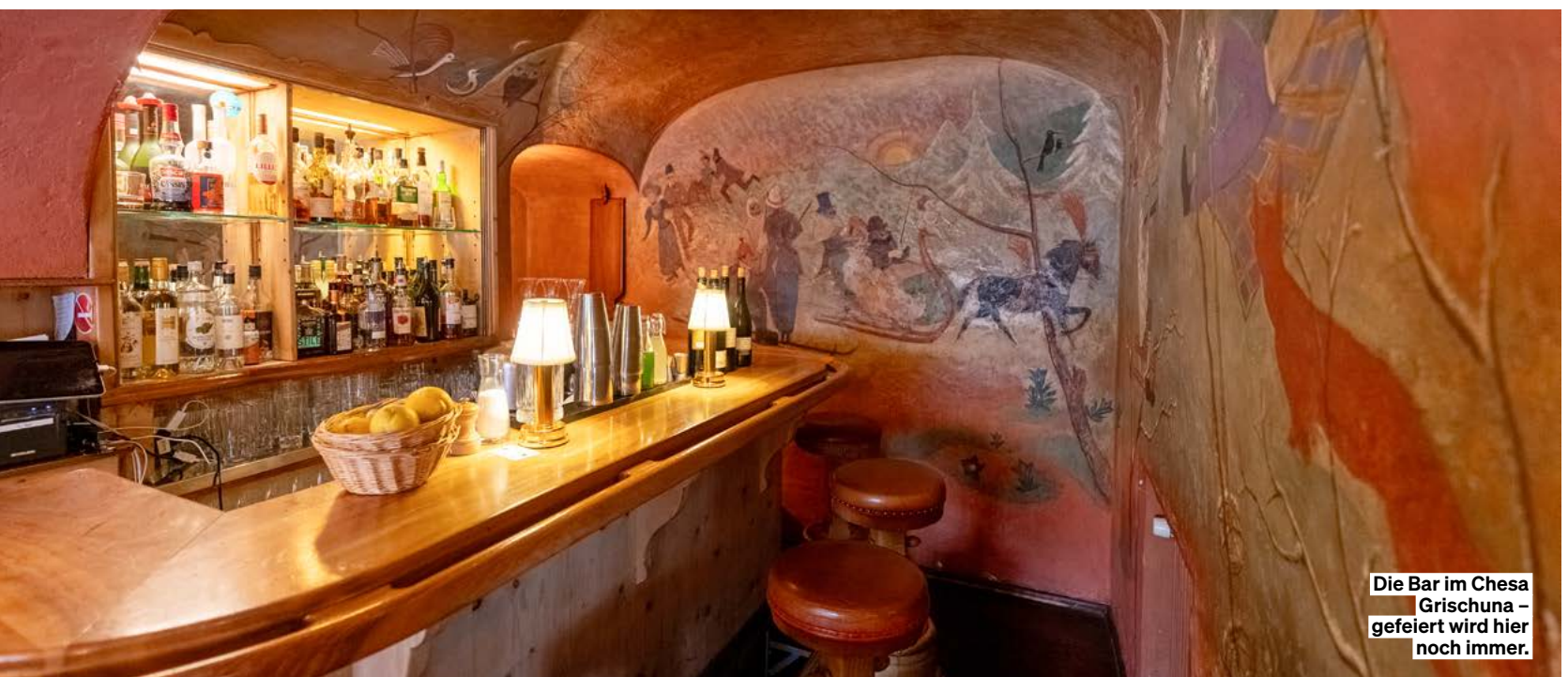
Die Bar im Chesa Grischuna – gefeiert wird hier noch immer.