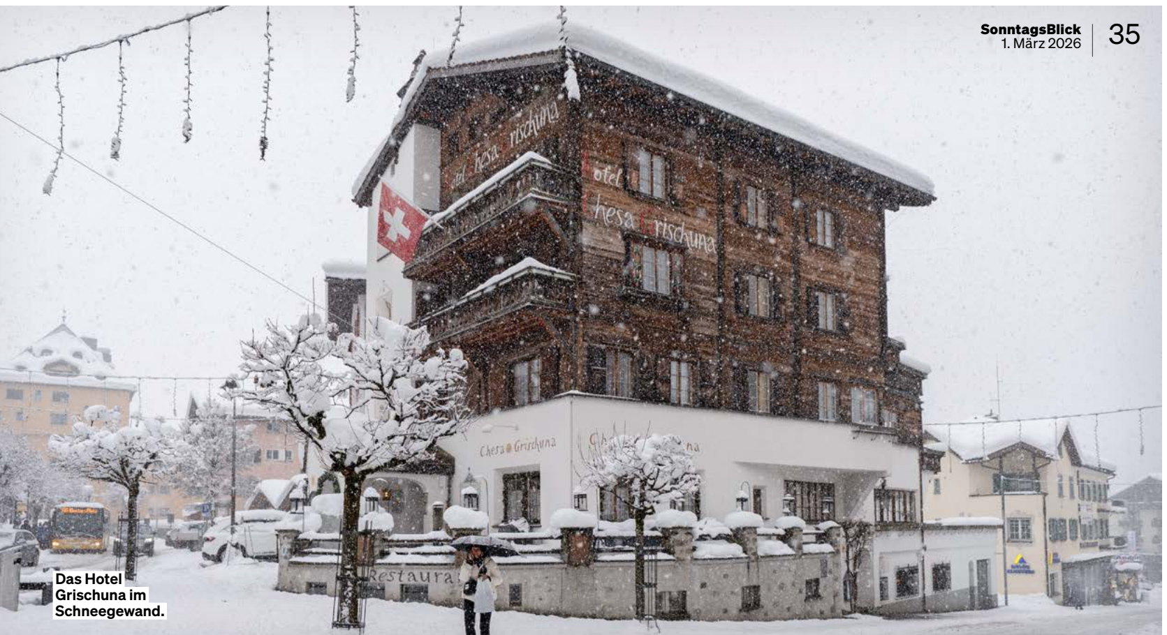
Das Hotel Grischuna im Schneegewand.