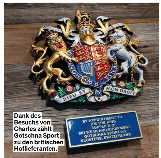
Dank des Besuchs von Charles zählt Götschna Sport zu den britischen Hoflieferanten.