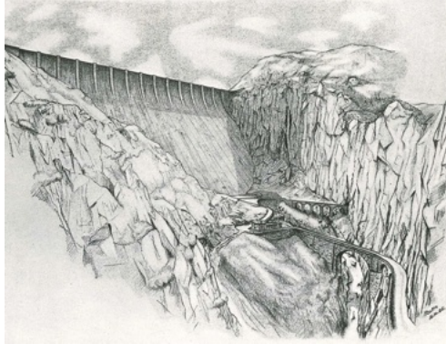
Diese Visualisierung zeigt die Staumauer im Urserental.

einem Volumen von rund 421 Millionen Kubikmetern aufstaut, mehr als heute bei der Grande Dixence ( https://de.wikipedia.org/wiki/Lac_des_Dix ). Dafür sollten rund 2000 Personen umgesiedelt werden, dazu Tausende Kühe, Schafe und Ziegen. 254 Bauernhöfe, Gewerbebetriebe und Hotels sowie 6,63 Quadratkilometer Kulturland würden untergehen. Die Gotthardstrasse, die Furkastrasse und der Anschluss der Bahn über den Oberalppass müssten verlegt werden. Sogar der nördliche Teil des Gotthard-Eisenbahntunnels würde in einer Schleife neu gebaut, um der Druckzone unter dem See auszuweichen.