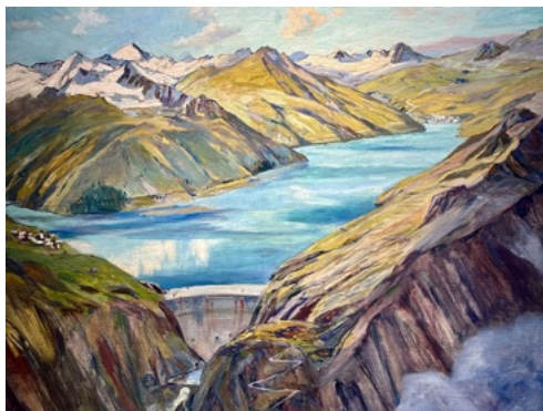
Für den Ursener Stausee hätten 2000 Menschen umgesiedelt werden müssen. Gemälde von Hans Beat Wieland, um 1940.

Doch die Ursener leisten einmütig Widerstand – Bauern, Gewerbler, Behörden, Politiker, sogar der Pfarrer. 1941 geben sie an einer ausserordentlichen Talgemeinde die Losung heraus: «Wir verhandeln nicht, wir verkaufen nicht, wir gehen nicht!» Die Korporation Urseren ruft dazu auf, «unsere Heimat zu retten» vor der kapitalistischen Habgier der «Herren von Elektrotrust». Von «Wühlarbeit» der Strombarone ist die Rede. Verräter werden gewarnt, die heilige Mutter Maria wird um Beistand angefleht. Die Ursener Bevölkerung verteidigt geeint ihre Heimat.