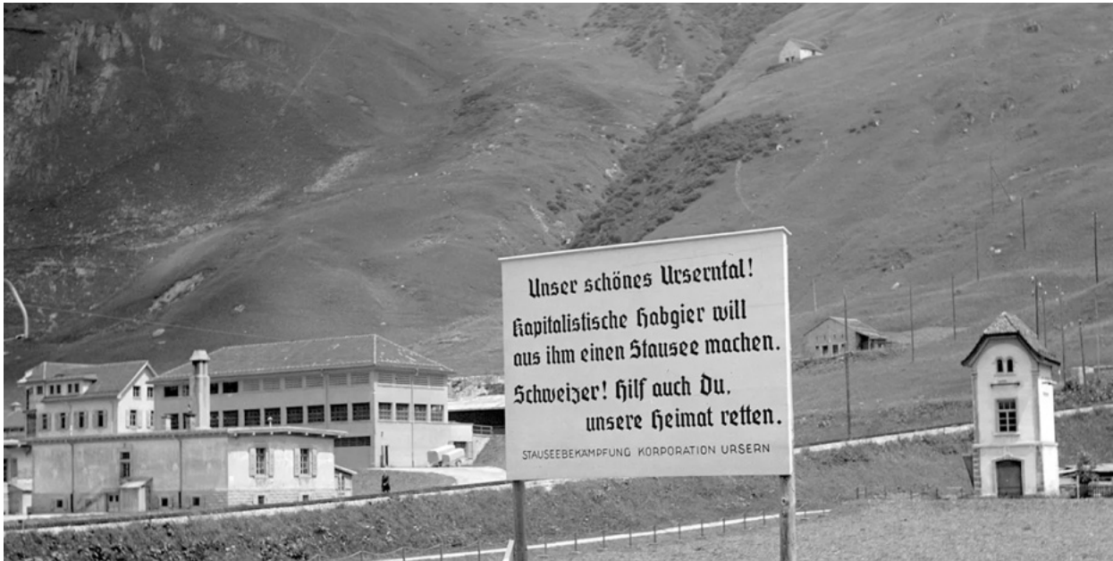
Der Protest gegen den geplanten Stausee beschränkte sich im Urserental nicht bloss auf Plakate ...