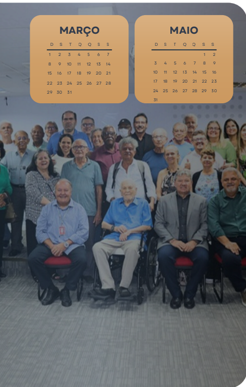
ENCONTRO EM SALVADOR - BA