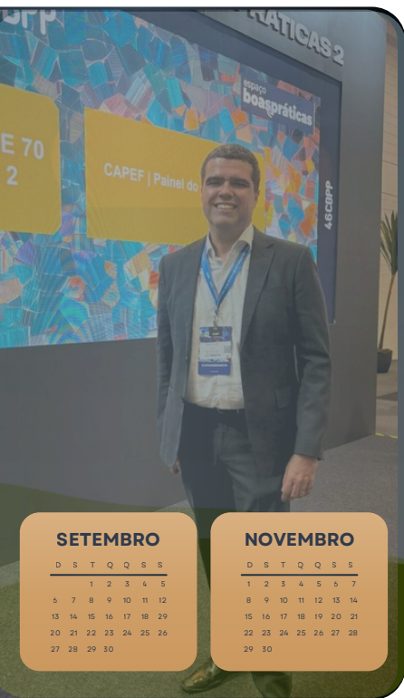
CONGRESSO DA ABRAPP - SP