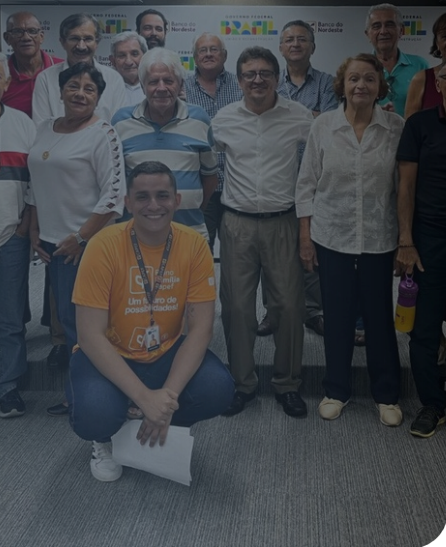
ENCONTRO EM SÃO LUIS - MA