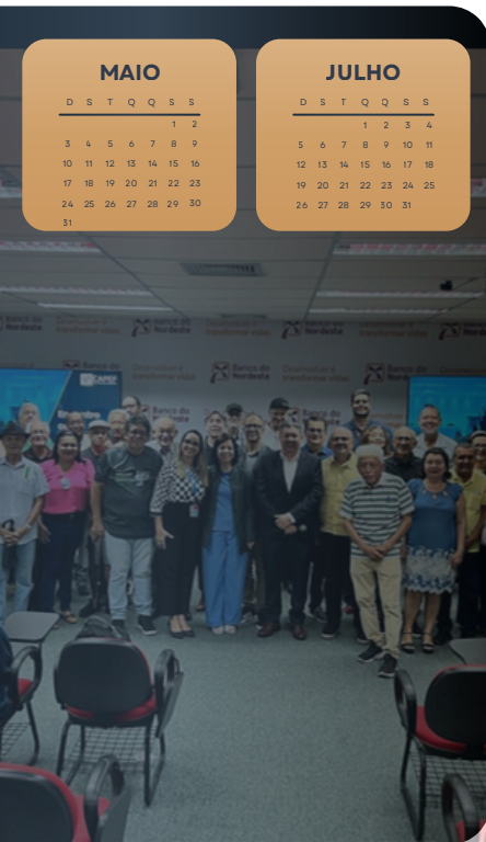
ENCONTRO EM RECIFE - PE