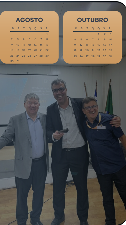
ENCONTRO EM FEIRA DE SANTANA - BA