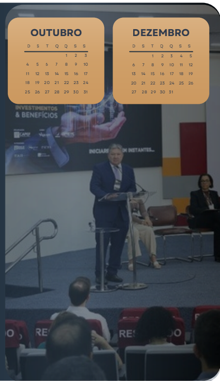
SEMINÁRIO DE INVESTIMENTOS E BENEFÍCIOS