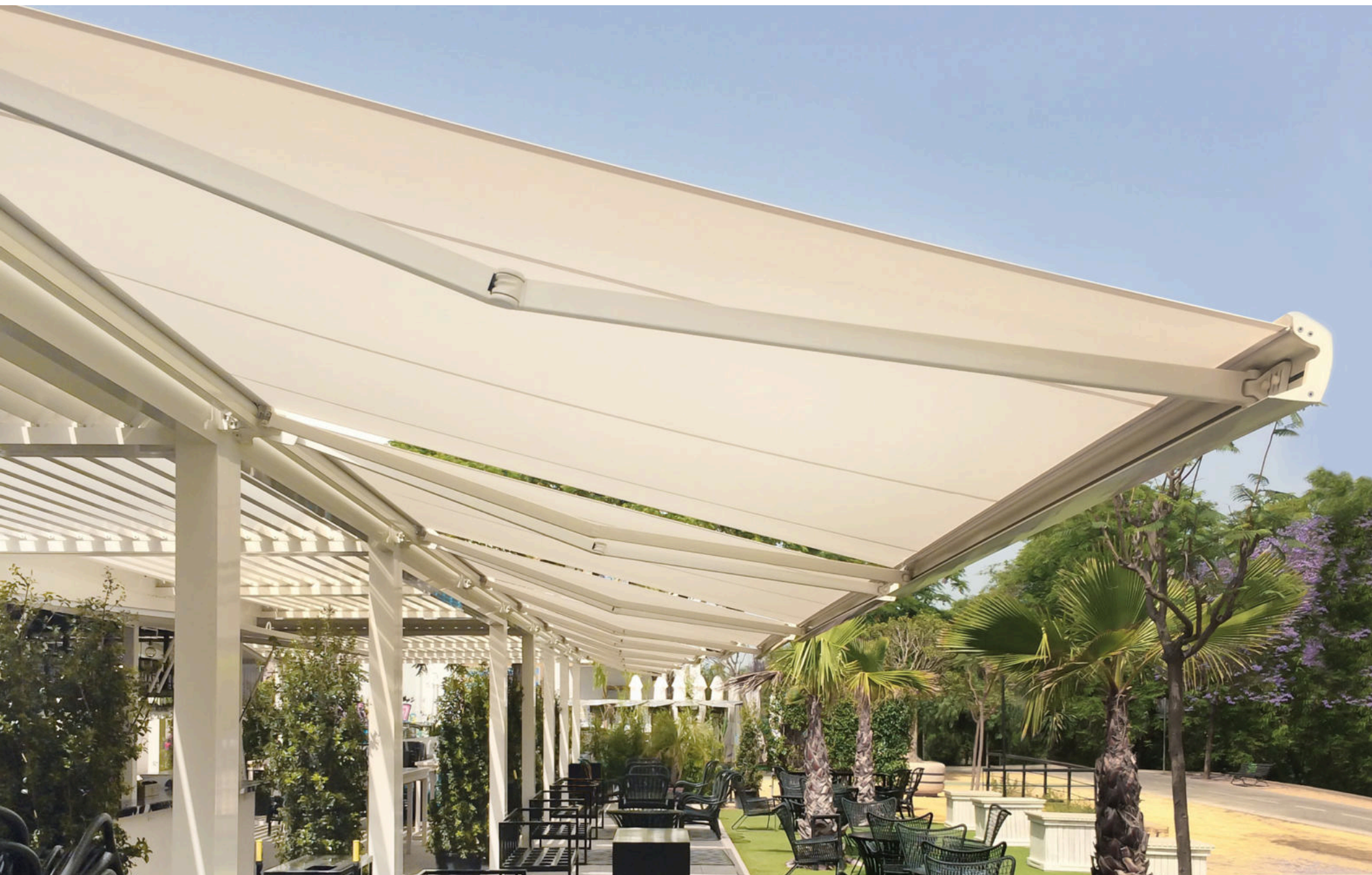
Pérgola acoplada con toldo extensible