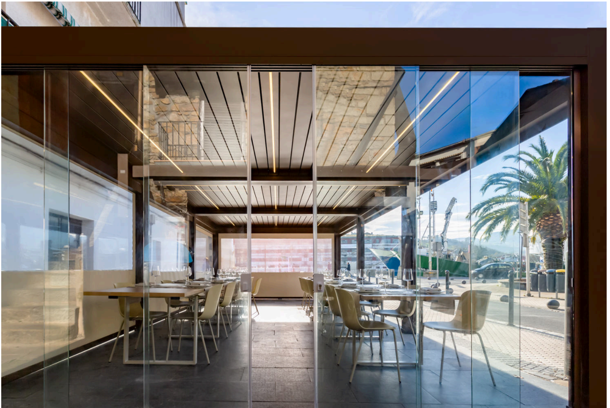
Pérgola bioclimática con led