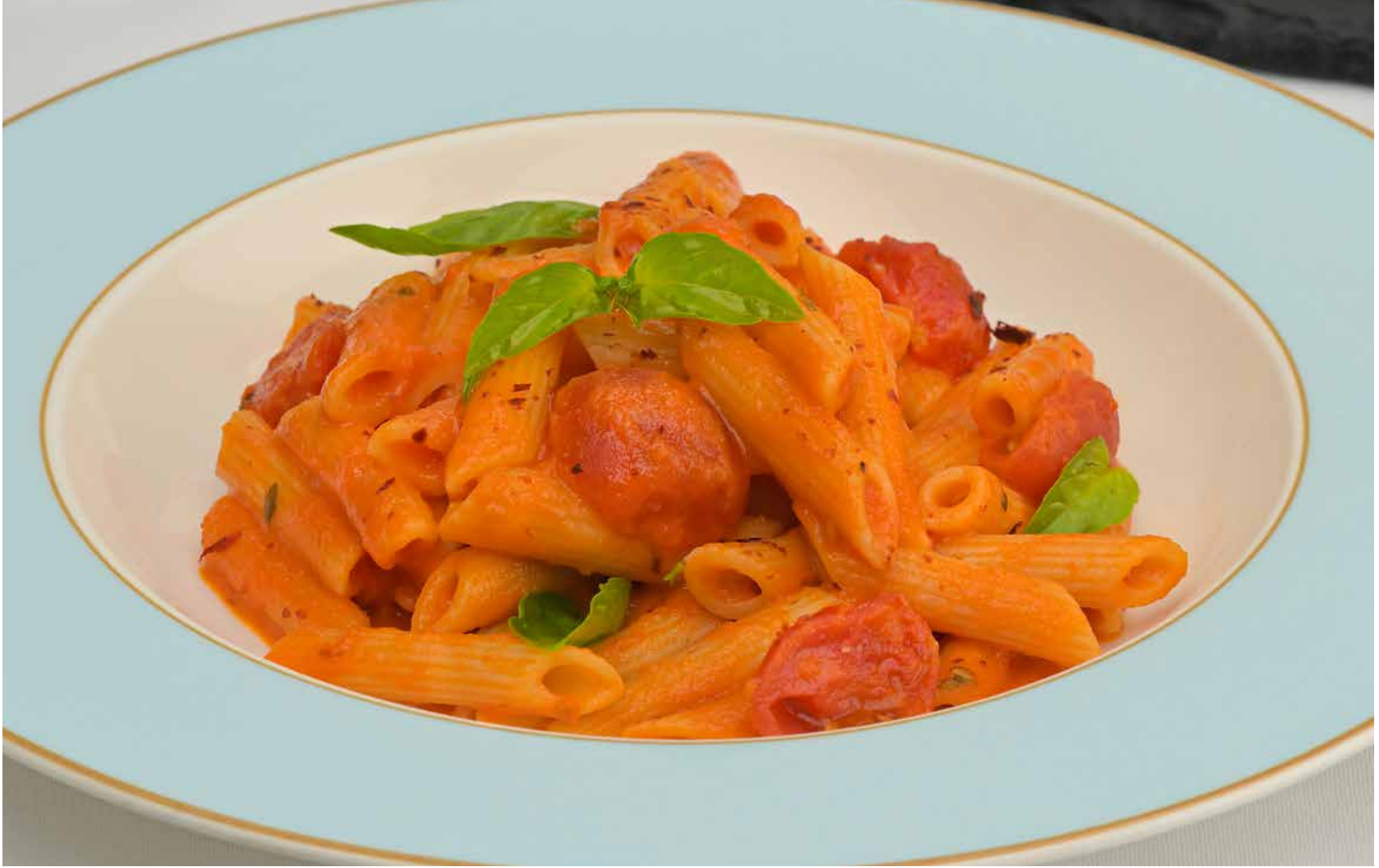
PENNE A LA TOMATE

Bolonez sos, kırmızı şarap, parmesan, biberiye Bolognese sauce, red wine, parmesan cheese, rosemary