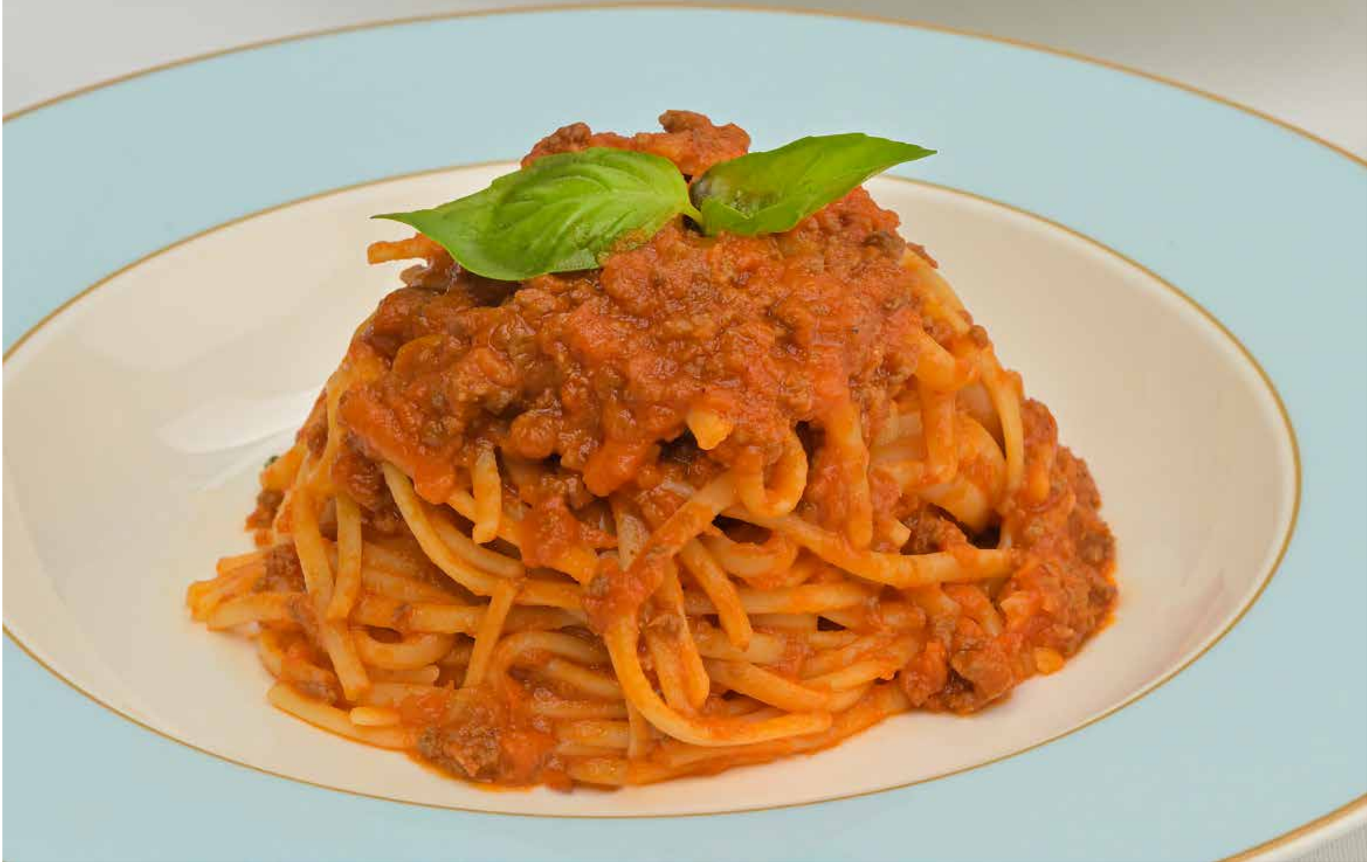
LINGUINE A LA BOLOGNAISE**