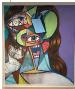
George Condo, Untitled.

Mack beskriver sin samling som djupt personlig och