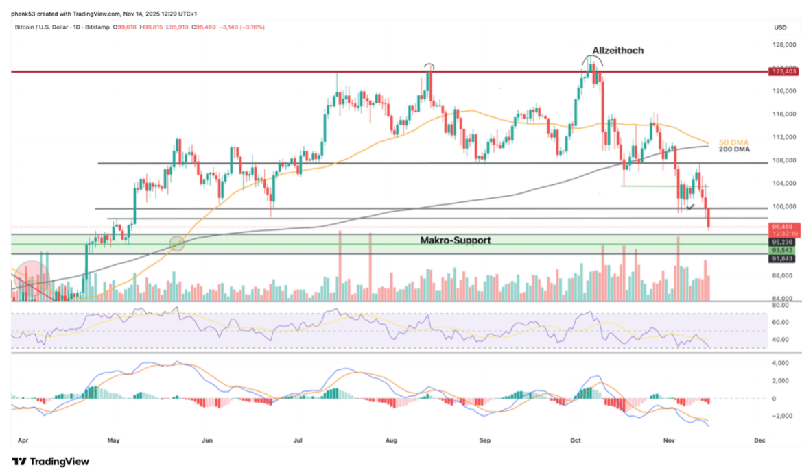
Chart: Bitcoin

Nachdem Bitcoin (BTC) am Dienstag an die Widerstandslinie von 107.500 US-Dollar herangelaufen ist, fiel der Kurs am Donnerstag unter den psychologisch wichtigen Support bei 100.000 US-Dollar und hat damit ein neues Tief markiert.