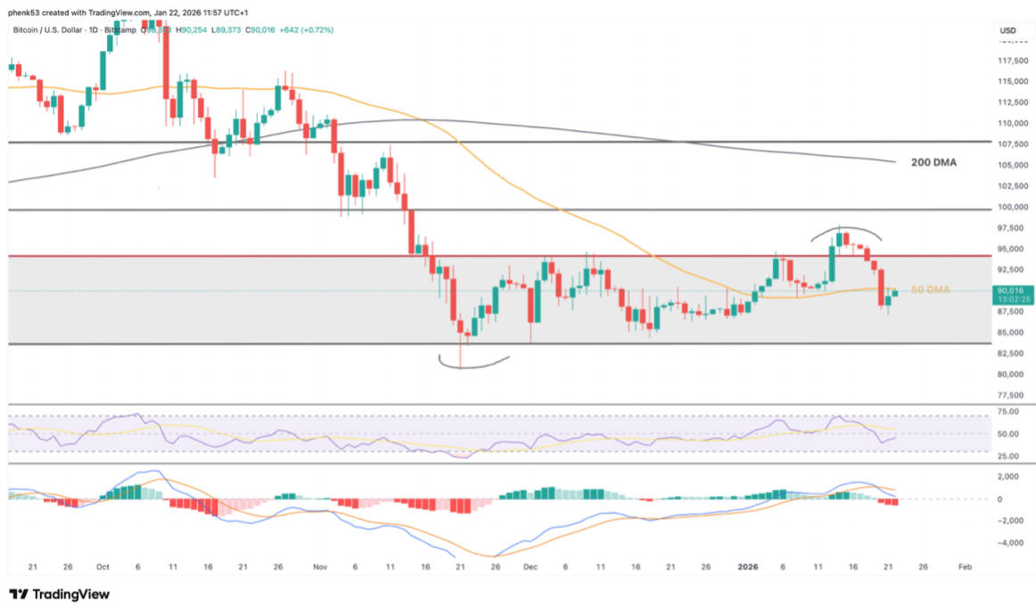
Bitcoin-Kurs ringt mit dem 50 DMA, Indikatoren sind bärisch