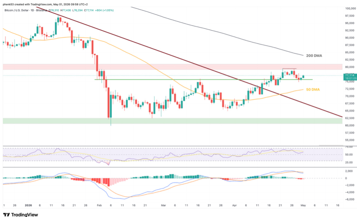
Bitcoin-Kurs scheitert am 80.000er-Widerstand und konsolidiert oberhalb der 75.000er-Unterstützung

Solange Bitcoin oberhalb von 74.000 US-Dollar schließt, bleibt die im April aufgebaute Bodenformation intakt. Diese Marke war über Wochen Widerstand und hat sich jetzt als neue Unterstützung etabliert – exakt der Verlauf, den eine saubere Trendwende benötigt. Die 50-Tage-Linie verläuft bei rund 71.000 US-Dollar und liefert eine zweite wichtige Unterstützung. Erst ein Tagesschluss unterhalb von 70.000 US-Dollar würde das bullische Setup invalidieren und einen Re-Test der Februar-Tiefs bei rund 60.000 US-Dollar wieder ins Spiel bringen.