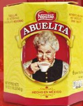
CHOCOLATE ABUELITA 6 TABLETAS 19 OZ