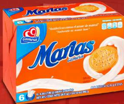
GALLETAS MARIÁS GAMESA 29 OZ