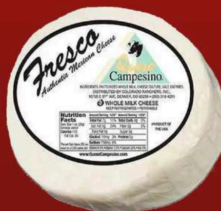
TALPA QUESO FRESCO 12 OZ