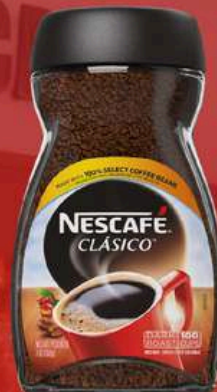
NESCAFÉ CLÁSICO DARK ROAST 7 OZ