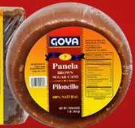
PANELA GOYA 16 OZ CUADRADA Y REDONDA