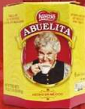
CHOCOLATE ABUELITA 6 TABLETAS 19 OZ