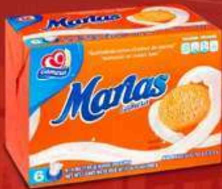
GALLETAS MARIÁS GAMESA 29 OZ