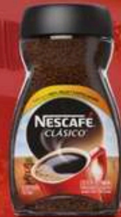
NESCAFÉ CLÁSICO DARK ROAST 7 OZ