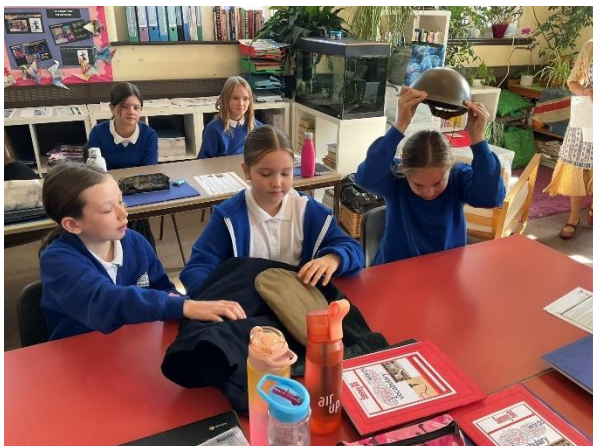
Blwyddyn 6 yn dysgu am yr ail ryfel byd efo Archifdy Conwy/Year 6 learning about the Second World War with Conwy Archives.