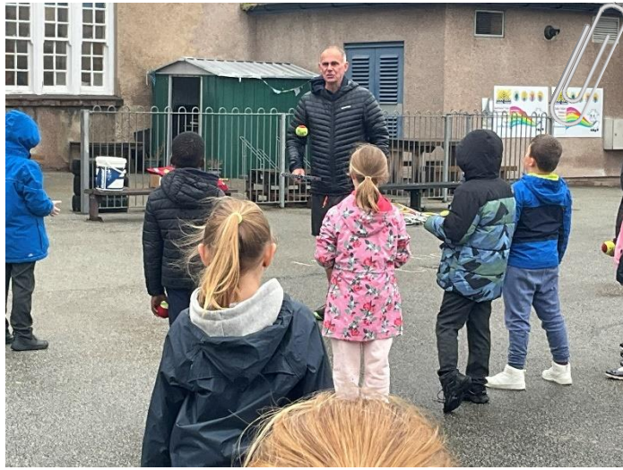
Blwyddyn 4 yn mwynhau gwersi sgiliau tenis gyda Chlwb Tennis Craig y Don. Year 4 enjoying their tennis session with Craig y Don Tennis Club on the school yard.