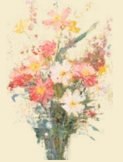
Santjie Combrink Eenheid 12