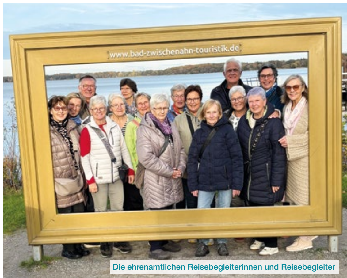
Die ehrenamtlichen Reisebegleiterinnen und Reisebegleiter