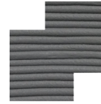
Cor Sólida Solid Color