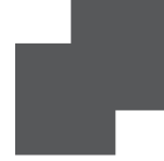
Metal Lacado Lacquered Metal