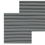
Cor Sólida Solid Color