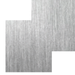
Aço Inoxidável Escovado Stainless Steel Brushed