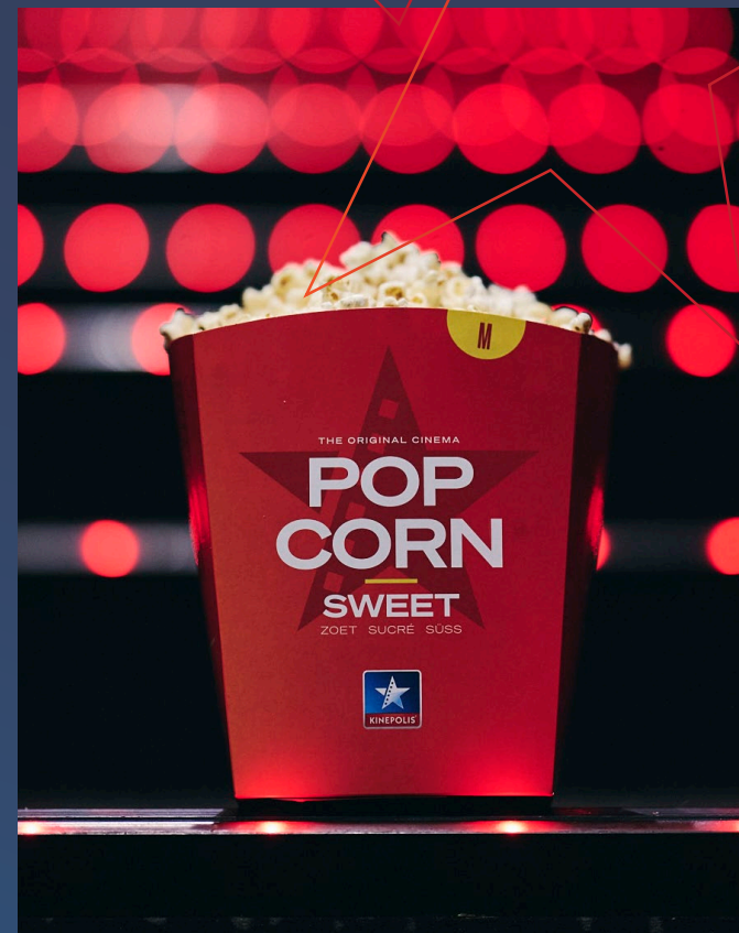
WHERE BUSINESS MEETS PLEASURE