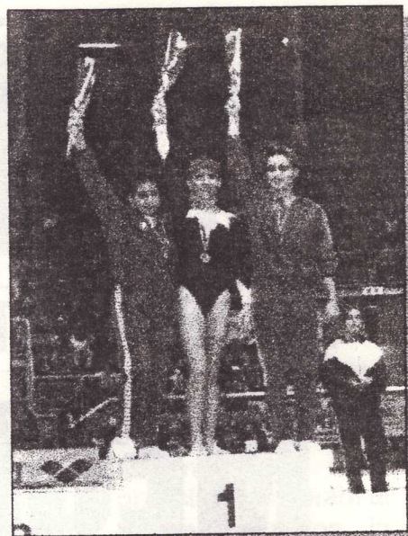
Il Podio degli Assoluti