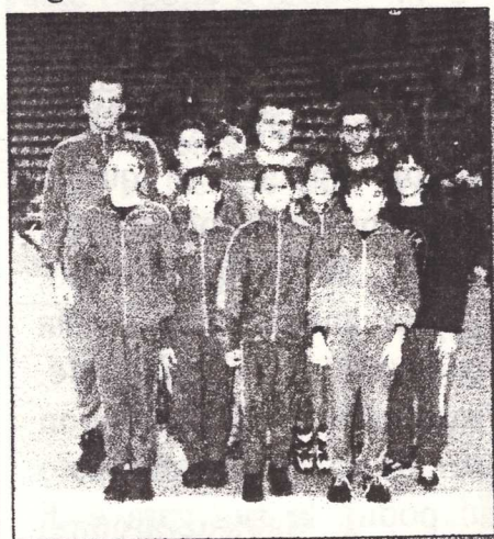
Foto di gruppo dopo al termine degli assoluti di Bologna.