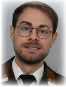
Jugend HLM d.F. Manuel Arbeiter