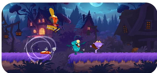
Détail des jeux de rythme

Un entraînement rythmique qui cible les déficits de traitement temporel, mécanisme qui sous-tend les difficultés phonologiques dans la dyslexie.