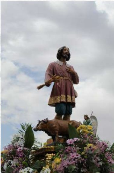
Patrón de nuestros campos Luis Pradillos