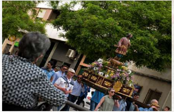
Viendo la Procesión Santiago Benito