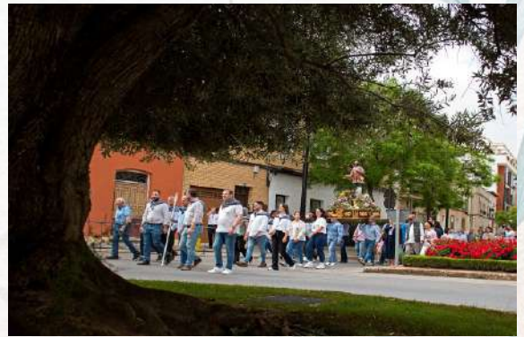
Paso por la rotonda del olivo Santiago Benito