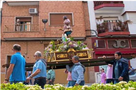
Desfile Santiago Benito