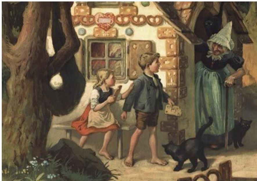
Illustration : Hansel et Gretel, Otto Kubel (1868 – 1951) © Domaine public

De plus, la malveillance de cette femme est soulignée, elle est prête à dévorer des enfants innocents. Elle vit seule et est isolée de toute vie. Donc, dès le plus jeune âge, on inculque à des enfants le fait que des vieilles femmes, isolées et seules, sans mari et sans enfants peuvent être des sorcières qui vont profiter du moment où les parents ne sont pas là pour les kidnapper. Image caricaturale de la femme au nez crochu, ce conte donne l'idée qu'une femme isolée est un symbole de dangerosité. Baba Yaga sorcière slave issue du folklore slave suit elle aussi son chemin vers la stigmatisation et évoque presque la sorcière