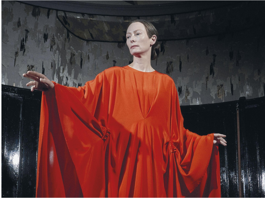
Suspiria, Lucas Guardano, 2018