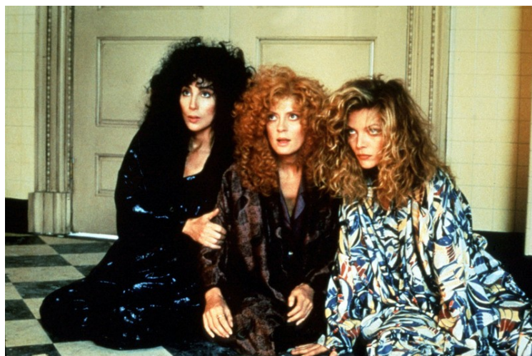
Image : Les sorcières d'Eastwick, Georges Miller, 1987, image issu du film

Historiquement, la sorcière était un mal en soi, en 1960, le cinéma a commencé, à prendre ses distances avec les stéréotypes. Ce tournant marque les esprits et nous prouve l'apparition d'une forme de sorcière bien plus complexe et complète. « Quand une épouse se débarrasse d'un mari, ou un mari d'une épouse, que ce soit par la mort, la désertion, ou le divorce, la femme éclot ! Elle s'épanouit ! Comme une fleur. » Cette citation récitée par Jack Nicholson dans les sorcières d'Eastwick , de Georges Miller montre dans un premier temps l'avancée des pensées envers les femmes veuves, célibataires, sans enfant. En effet je le rappelle très souvent les femmes veuves, seules, et, ou sans mari étaient très mal vu à la période médiévale et très vite accusées de sorcellerie. De manière très crue, le film aborde le fait que les hommes ne supportaient pas qu'une femme soit puissante. En-dehors des dialogues qui sont à certains moments très intéressants à relever. L'histoire est d'autant plus pertinente, trois femmes deviennent des sorcières, Alexandra, Jane, et Sukie en voulant « inventer » l'homme idéal, elles vont malencontreusement faire arriver le diable sous forme d'homme chez elles (Daryl Van Horne) qui deviendra plus tard leur « maître » . Au départ, elles transgressent les normes sociales et utilisent leurs pouvoirs à des fins personnelles.