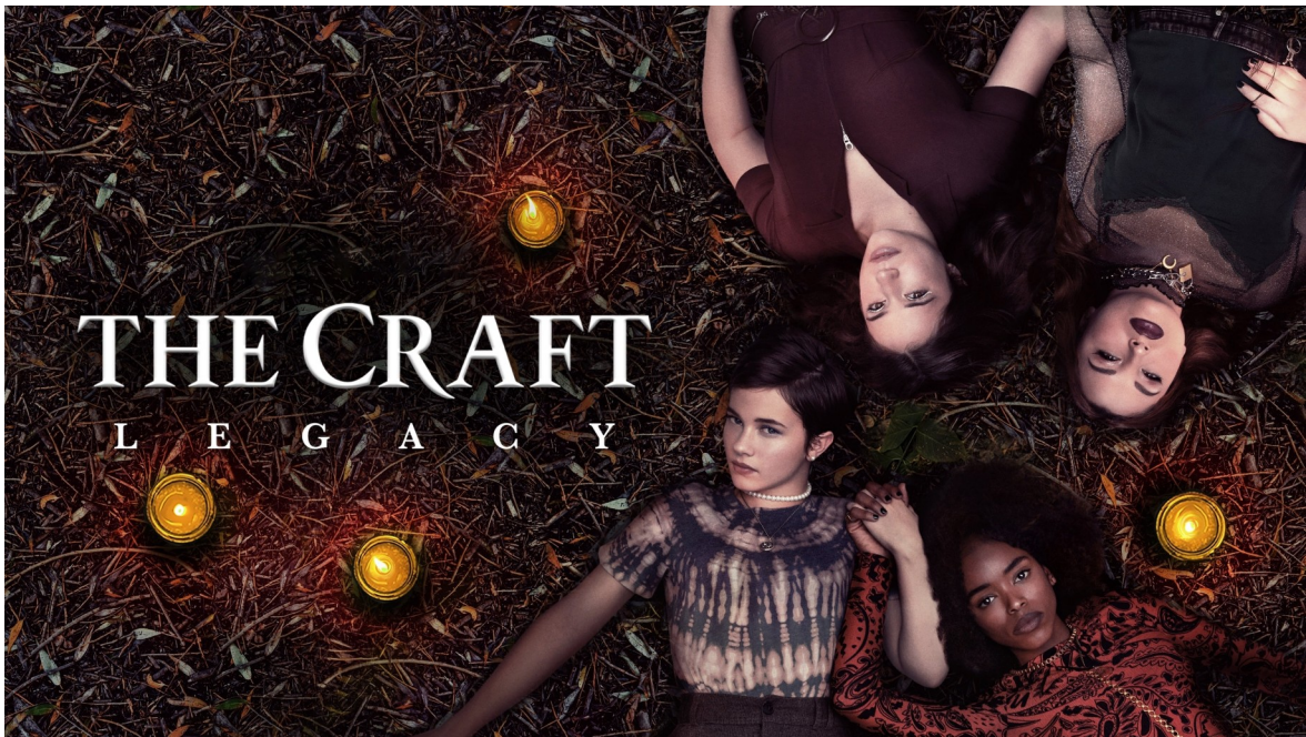
Affiche du film: The craft Legacy, 2020