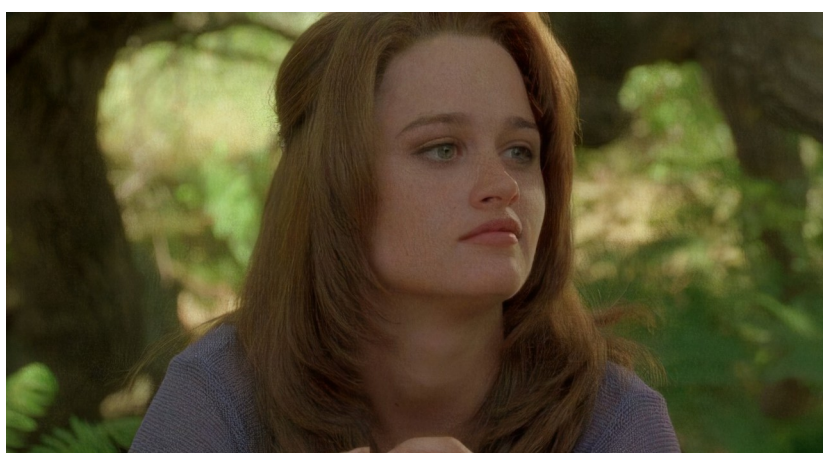
Image 1: The Craft, Andrew Fleming, 1996, Image de Sarah Bailey (Robin Tunney)

Un autre exemple très pertinent, qui nous montre à la fois des sorcières qui peuvent être marginalisées, mais joue avec la fine frontière entre l'héroïne et l'anti-héroïne, c'est The Craft . Dans ce film, la sorcellerie permet à quatre jeunes filles de prendre le contrôle de leur vie, Sarah, Nancy, Bonnie et Rochelle. Elles veulent toutes s'émanciper et former une sororité. Mais ces personnages vont très vite agir dans leur propre intérêt en voulant se venger des personnes qui leur ont fait du mal. Or, le personnage de Nancy va aller beaucoup trop loin dans cet égoïsme, et à la fin, c'est Sarah qui rétablit l'ordre dans un combat magique avec Nancy. La fin a un côté tragique pour le personnage de Nancy qui a trop voulu s'adonner à de la sorcellerie s'est perdue entre la frontière du bien et du mal. Par conséquent, elle finit sur un lit d'hôpital psychiatrique attaché avec des sangles. Ce film met de nouveau en garde sur les dangers d'un pouvoir incontrôlé et comment celui-ci peut entraîner des dangers psychologiques et moraux.