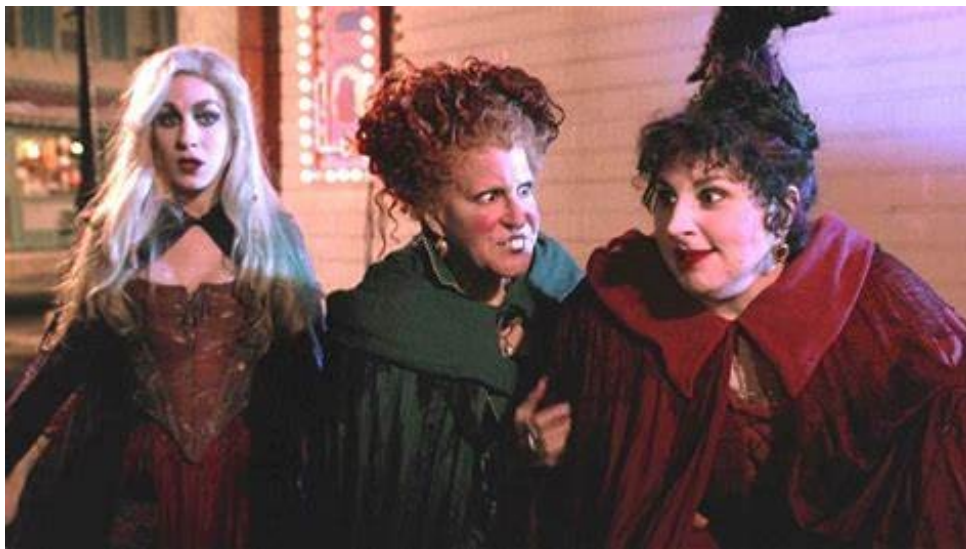
Hocus Pocus, Kenny Ortega, 1993