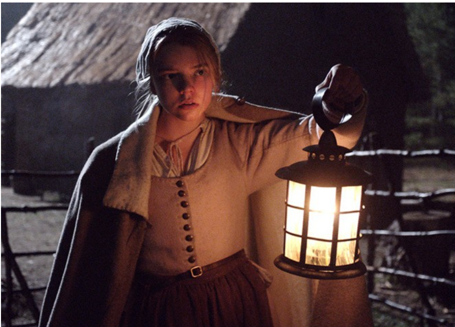
Image The witch, Robert Eggers, 2015