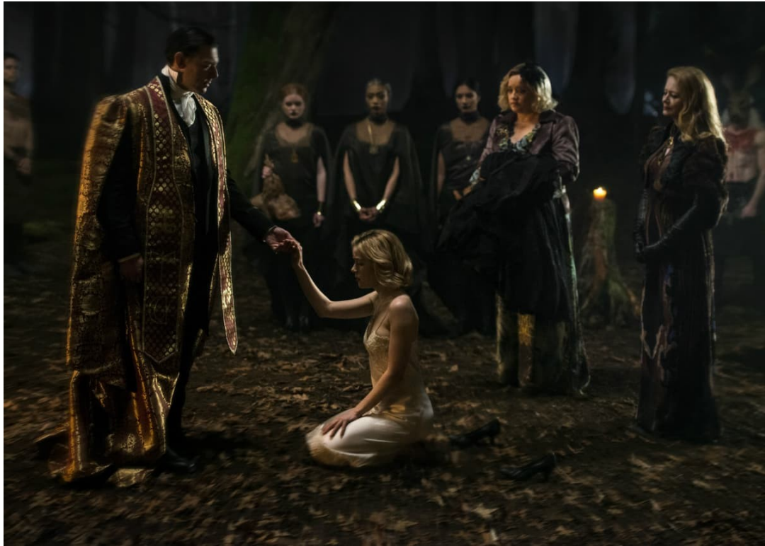
Image : Les nouvelles aventures de Sabrina l'apprenti sorcière , 2018 ©

Dans les deux films The Craft , les adolescentes symbolisent cette rébellion de part leur style vestimentaire unique et porte leur esthétique à travers ça, mais aussi grâce à leur émancipation. Malgré tout, les représentations sont diversifiées et l'esthétique derrière chaque film est unique. La sorcière devient universelle et identifiable de tous. Elle proclame sa liberté dans ses choix, elle montre une solidarité entre femmes et pour finir elle incarne une égalité. Ses représentations diverses permettent une identification virale, la sorcière est un outil narratif qui incarne des idéaux d'empowerment féminin en les symbolisant. Cette métamorphose donne à penser que ces valeurs d'émancipation et de puissance peuvent être accessibles par tout le monde.