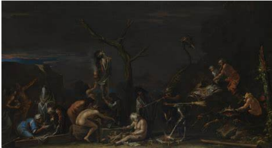
Tableau : Salvator Rosa, Witches at their Incantations , vers 1646, the national Gallery, huile sur toile, 72 × 132 cm

Cette stigmatisation a lieu à cause du texte d'appui de l'époque le Malleus Maleficarum , « Et en conséquence, on appelle cette hérésie non des « sorciers » mais des « sorcières » car le nom se prend du plus important. », car oui les femmes étaient plus sujettes à la tentation car étant moins intelligentes, elle ne pouvait y résister. 5 Cette citation nous dépeint la triste opinion sexiste de la société de l'époque. On constate avec toutes ces informations, la construction progressive de l'archétype visuel : femmes âgées, difformes, parfois diaboliques, souvent représentées dans des contextes occultes ou nocturnes. Cet archétype a quitté les pages de son traité et est sorti de ces peintures pour se réincarner dans de nouveaux supports comme le cinéma et la littérature. La sorcière a eu le droit à sa standardisation de cliché et traverse les siècles avec une idée collective plutôt précise. Alors ouvrez grand vos livres et passons le quatrième mur pour visualiser cette figure au départ stéréotypée.