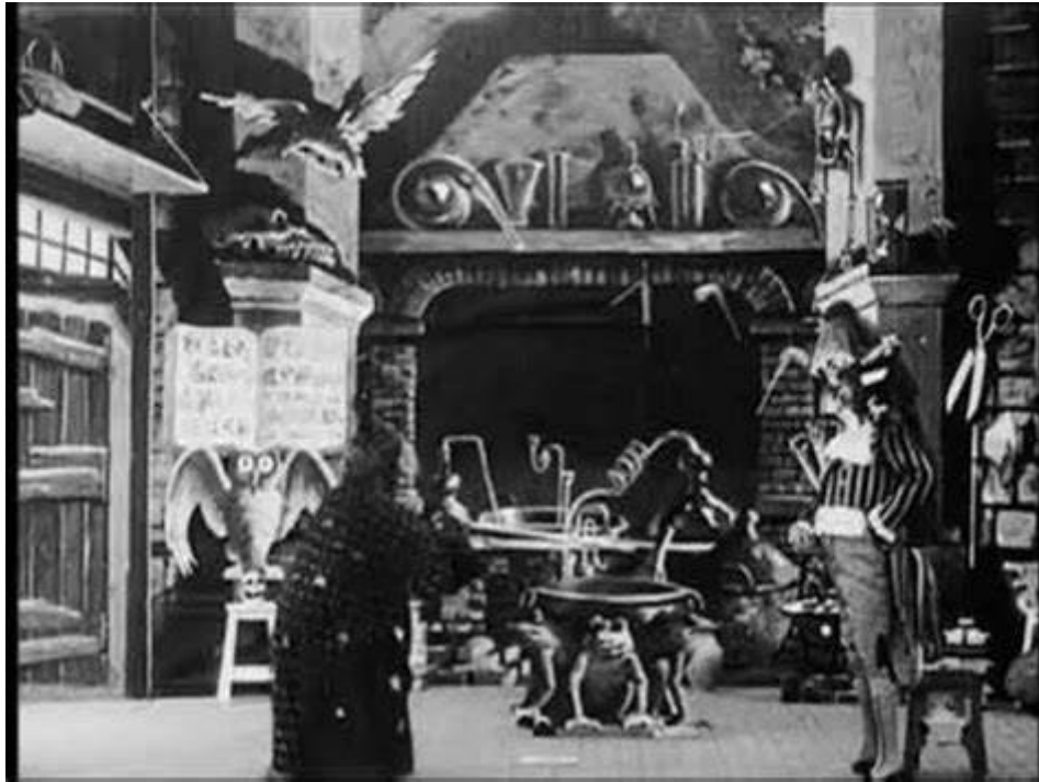
Image : Chez la sorcière, Georges Méliès, 1901

Blanche-neige sorti en 1937, tiré du conte des frères Grimm souligne à la perfection ce propos et ne s'émancipe en aucun cas de la vision biaisé de la méchante sorcière. Au contraire ce dessin-animé, s'applique dans le jeu de donner à la sorcière une mauvaise image celle de la méchante qui ne veut qu'une chose, que le personnage principal meurt pour rester incontestablement la plus belle. En revanche, des nouvelles figures vont faire leur apparition quelques années après et vont permettre le début d'ambivalence beaucoup plus profonde quant au sujet de la sorcière.