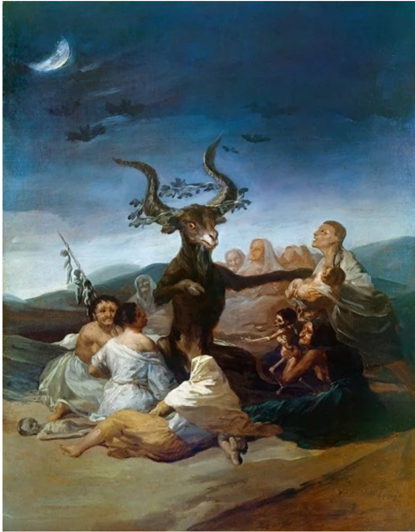
Tableau : Francisco de Goya, Le Sabbat des sorcières (el Aquelarre), 1797-1798 huile sur toile • 43 x 30 cm • Fundación Lázaro Galdiano, Madrid •

Ces trois œuvres nous montrent que la sorcière a longtemps été marginalisée, de plus avant même l'apparition du cinéma un stéréotype se dégage de tous ces actes picturaux. La femme vieille ou jeune, qui chevauche un balai pour aller au sabbat et servir le diable. Les symboles associés aux sorcières sont souvent le chaudron, le balai, mais aussi le familier. Durant la période médiévale, si vous étiez vu avec un chat, cela voulait dire que vous étiez une servante du Malin. Le tableau, Witches at Their Incantations de Salvator Rosa, réalisé en 1646 montre ce fameux chaudron.