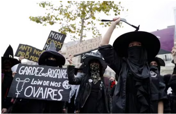
Photo : Le Witch Bloc manifestait le 28 septembre 2017 pour le droit à l'avortement. THOMAS SAMSON / AFP