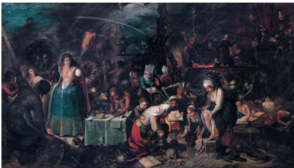
Tableau: Frans Francken the Younger, The Witches Sabbath , 1607, huile sur toile, 56 x 83,5 cm, Kunsthistorisches Museum Wien

tableau reste inchangé et vient enlaidir la nature de cette femme. Cette œuvre respecte les dogmes de l'époque et s'accorde avec les mœurs et les pensées des villages européens.