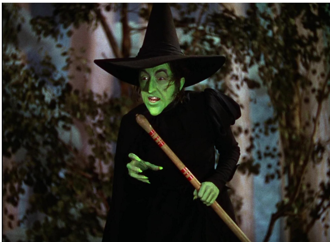
Image: Le magicien d'Oz , 1939, La méchante sorcière de l'Ouest (Margaret Hamilton)

caractéristiques clichées sont présentes, elles sont mises en opposition. Le masque tombe enfin, cette figure peut enfin se valoriser et prouver qu'elle peut se diversifier en revanche elle perpétue certains préjugés.