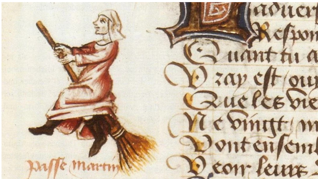
Illustration: L'une des première représentations de la sorcière faites par Martin Le Franc, Extrait de Le Champion des Dames, 1440, manuscrit enluminé, BnF de Paris

La première représentation de sorcière fut son apparition en 1440 dans le livre de Martin Le Franc, Le champion des Dames . Cette œuvre marque donc les esprits, une image en ressort en effet une femme chevauche quelque chose d'inhabituel puisque ce n'est autre qu'un balai. Mais pas n'importe lequel celui-ci vole. On retrouve là un des attributs célèbres de cette figure émergente. À travers cette première œuvre, on peut voir se dessiner un premier contour de l'ombre ensorceleuse, bien qu'elle ne soit pas représentée de manière hideuse et vieille. Elle marque le début de nombreuses représentations stéréotypées.