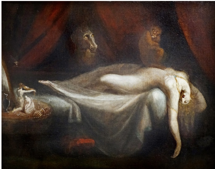
Tableau : Le Cauchemar, Johann Heinrich Füssli, 1781 huile sur toile • 101,7 x 127,1 cm • Detroit Institut of Art • © Detroit Institut of Art

En se plongeant très loin dans l'histoire, je vous invite à passer du côté de la mythologie. Dès lors certains historiens ont constaté que la sorcière pouvait posséder des ancêtres, alors regardons de plus près... La Mara, appelée plus communément le cauchemar est une figure emblématique du folklore scandinave. Cette créature étrange pouvait se faufiler n'importe où à la nuit tombée... Elle s'installait sur la poitrine d'un dormeur et le faisait suffoquer, des cauchemars venaient alors peupler la tête de sa victime. Mais ce n'est pas tout, il était aussi dit qu'elle utilisait les animaux en les chevauchant jusqu'à épuisement durant la nuit. La Mara est intrinsèquement liée à la Succube, en effet, elle cache en réalité sa vraie nature démoniaque derrière de très jolis traits. Elle vient séduire ses victimes pour ensuite prendre possession des rêves afin de les accabler, la succube sert le mal. D'autres disent qu'elle abuse de ses victimes... Elles opèrent autant l'une que l'autre la nuit, et agissent sur les rêves. Les deux vont envahir un espace intime de l'esprit et laisser des traces après leur