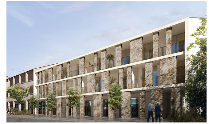
Origine Levant 159 bd du Levant - 83 230 Bormes les Mimosas